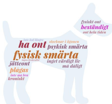
Figur 1. Djurägarnas definition av lidande. Figuren är gjord i WordArt.com ( https://wordart.com/terms/free-license )

De intervjuade djurägarna och veterinärerna var relativt överens om att ordet lidande har en stark betydelse. Veterinär A beskrev definitionen av lidande som ”fysisk smärta” och att ett djur kan lida antingen på grund av smärtan i sig eller av oförmågan att kunna göra något till följd av smärtan, exempelvis att kunna äta. Övriga nio av tio intervjuade menade att lidande innebär något mer än en lättare fysisk smärta och att lidande uppstår först i ett senare skede. Figur 1 och 2 visar ord som användes för att definiera lidande.