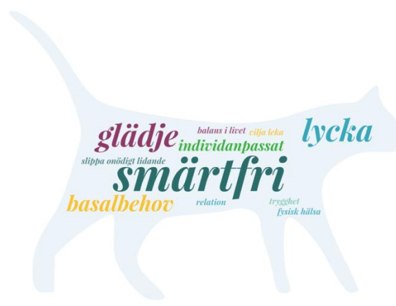
Figur 4. Veterinärernas definition av livskvalité. Figuren är gjord i WordArt.com ( https://wordart.com/terms/free-license )

Alla intervjuade djurägare var överens om att god livskvalité för ett djur innebär att djuret är väl omskött, får sina basala behov uppfyllda och att djuret får utföra sina naturliga beteenden. Exempelvis så ska utekatter få vara ute på dagen, arbetshundar ska få träna mycket och ett flockdjur ska få bo med andra djur av sin art. Djurägare 2 lade till att god livskvalité för djuret även innebär att djuret får spendera tid med djurägaren och att djuret känner att det får vara med. Djurägare 5 lade till att djuret måste ha en ”glöd” och en ”vilja att leva” kvar för att djuret ska ha god livskvalité. Djurägare 4 förklarar att hen studerar djurets fysiska hälsa och djurets beteende för att bedöma livskvalité men att det ofta bedöms via en magkänsla.