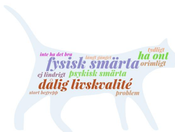
Figur 2. Veterinärernas definition av lidande. Figuren är gjord i WordArt.com ( https://wordart.com/terms/free-license )