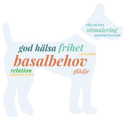
Figur 3. Djurägarnas definition av livskvalité. Figuren är gjord i WordArt.com ( https://wordart.com/terms/free-license )

Figur 3 och 4 visar ord som användes för att definiera livskvalité hos sällskapsdjur.