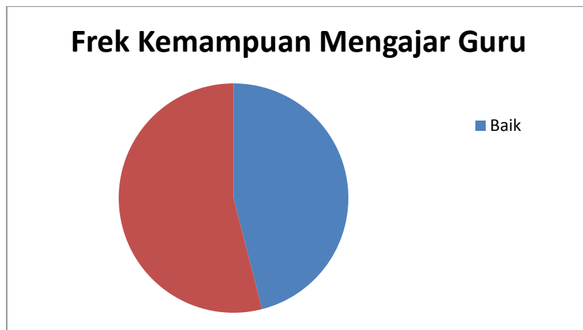
Diagram Lingkaran Distribusi Frekuensi Kemampuan mengajar guru