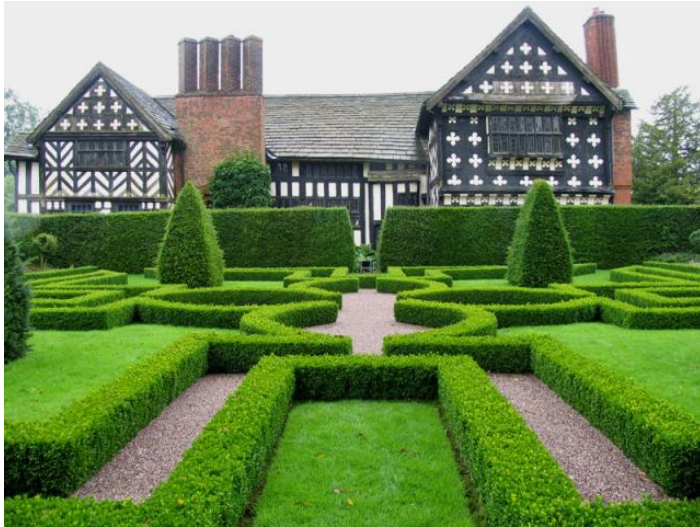
Aiuole bordate di bosso al Knot Garden di Little Moreton Hall, Cheshire, UK.