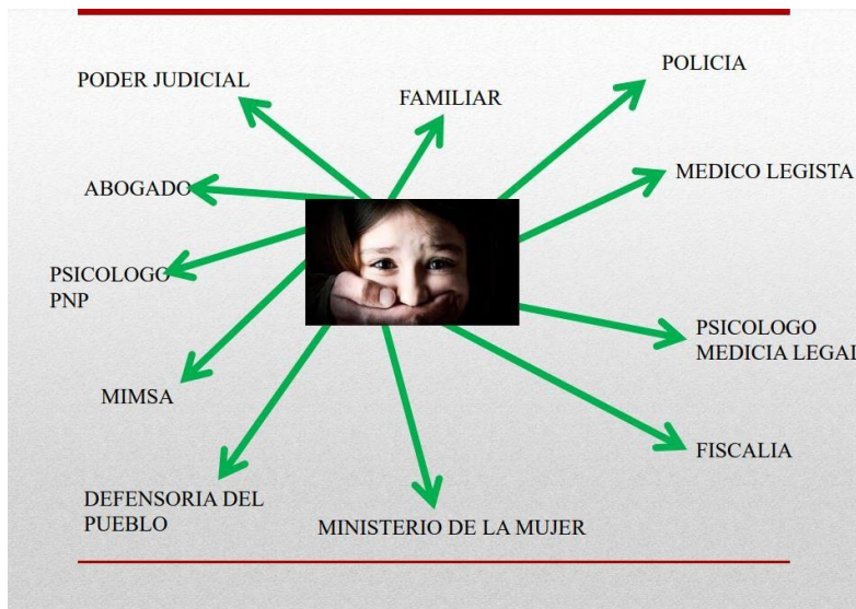
Gráfico N.º 2