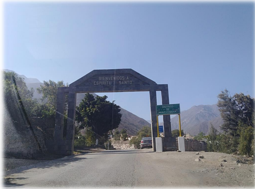
Ingreso a la localidad de Espiritu Santo.