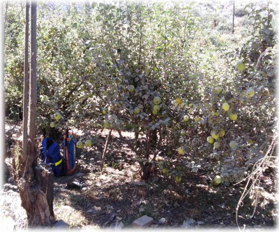
Cultivos de membrillo y manzana.