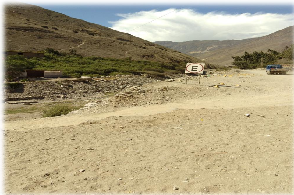
Zona de estacionamientos.