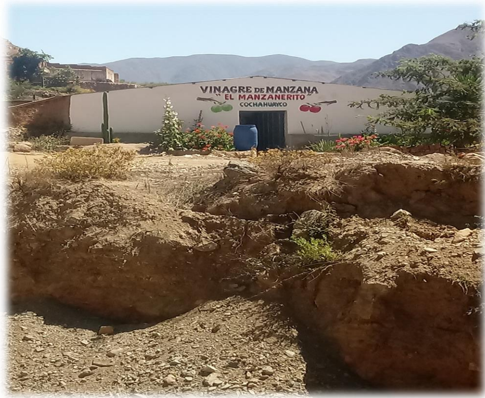
Planta artesanal de elaboración de vinagre.