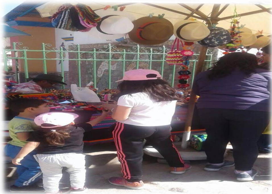
Ventas de artesanías y productos autóctonos.