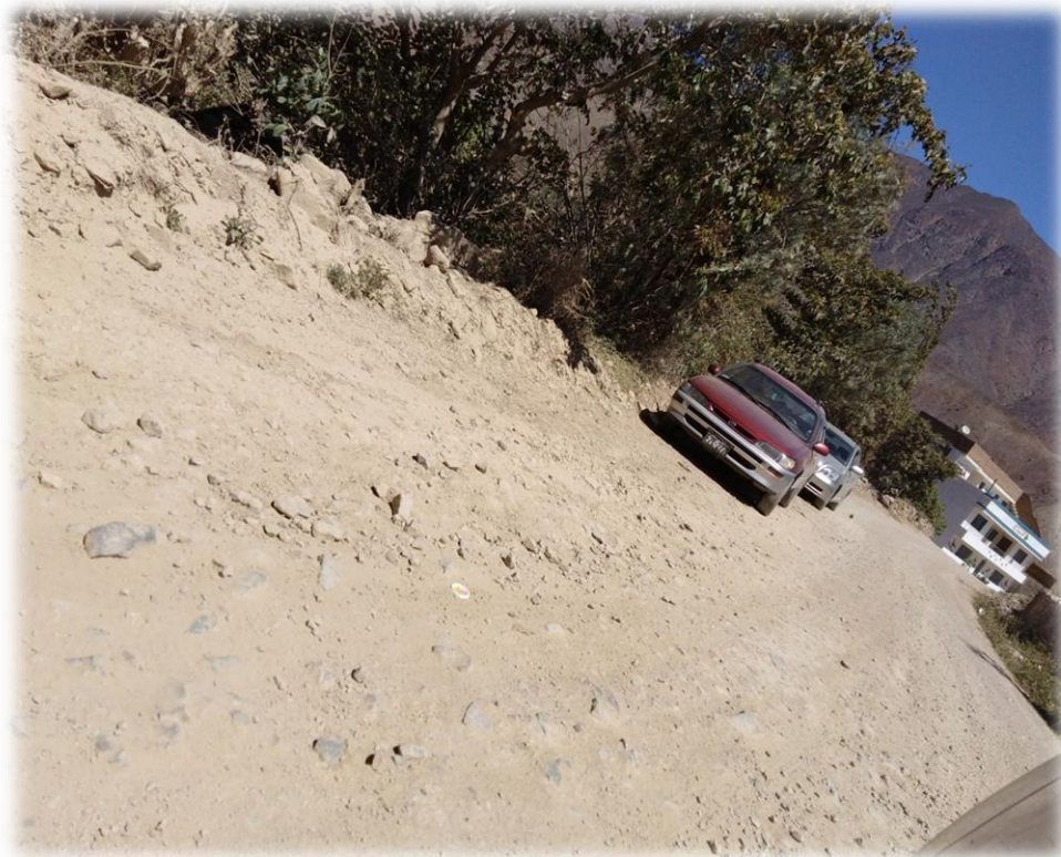
Vías de acceso - Antioquia.