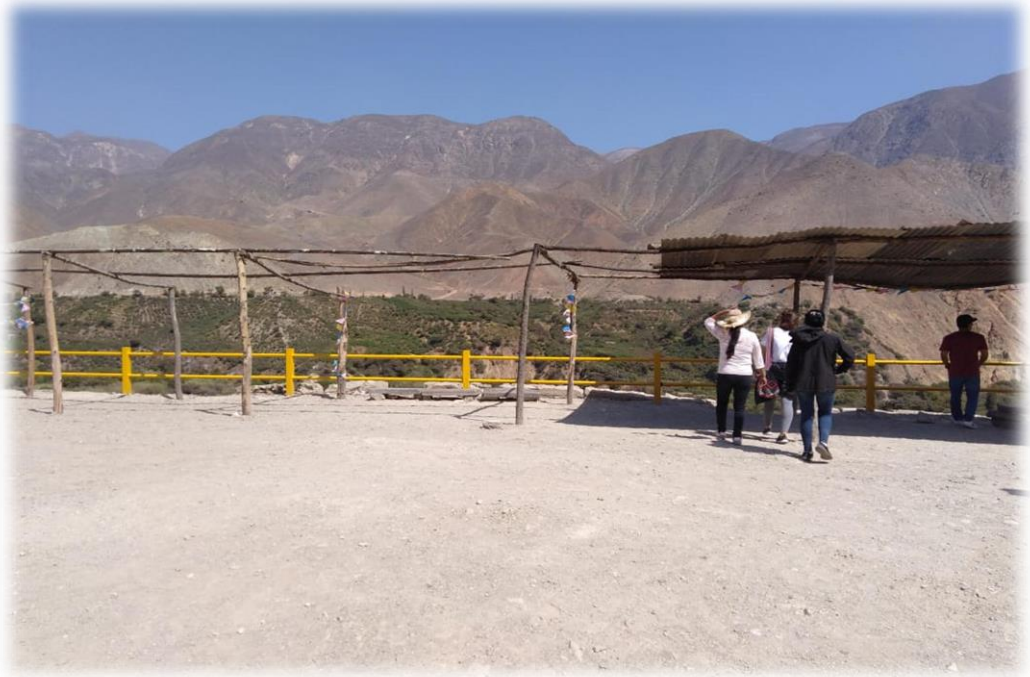
Mirador de Amancaes.