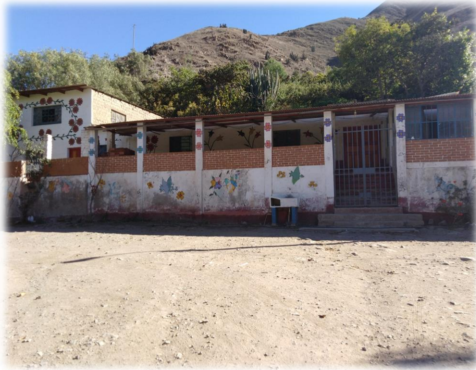
Viviendas de los Pobladores