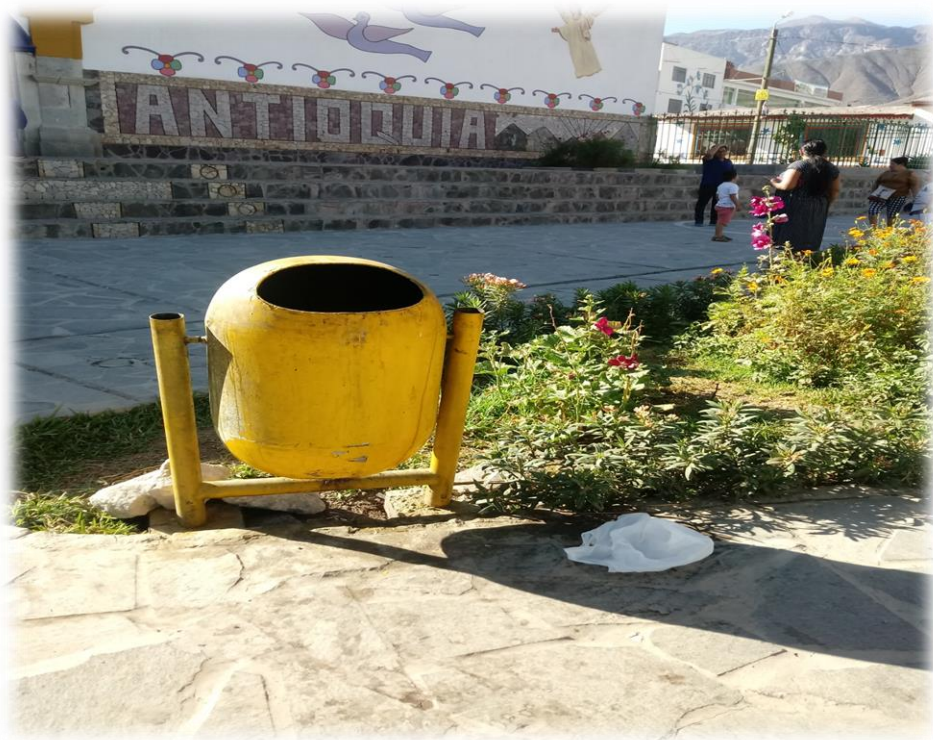
Tachos sin utilizar.