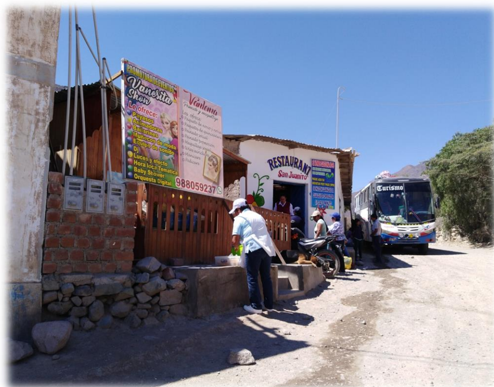
Estación o Parada de Vehículos