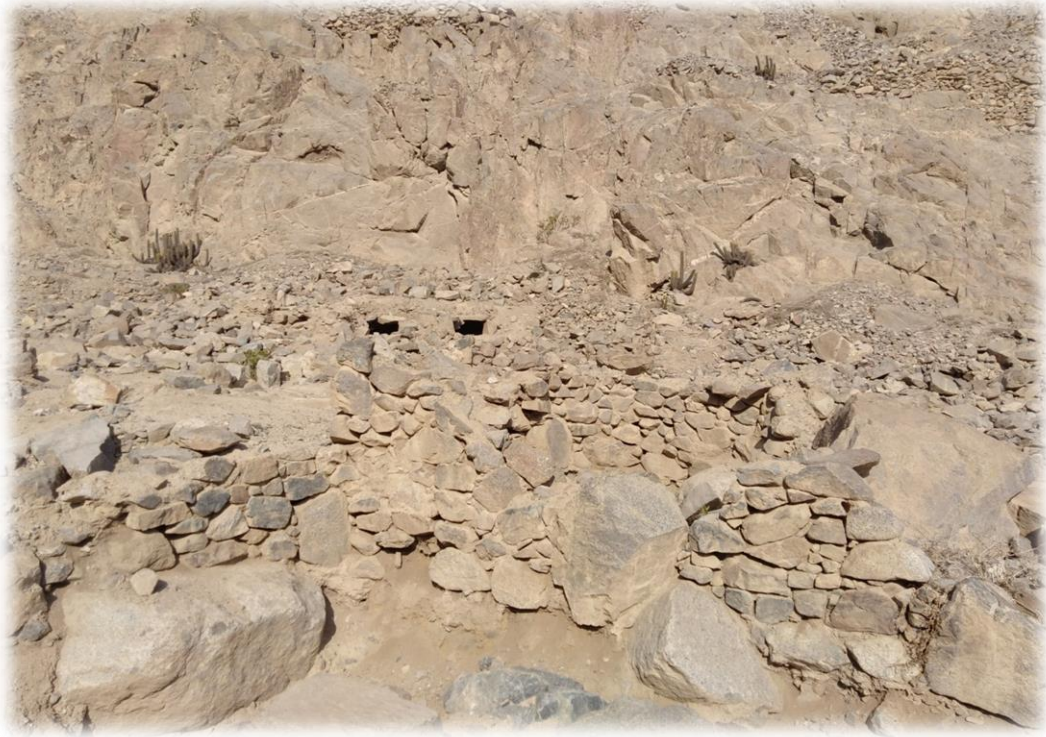
Restos humanos en la zona arqueológica – Nieve Nieve.