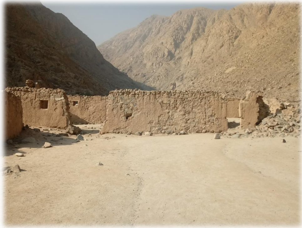
Ruinas arqueológicas en abandono.