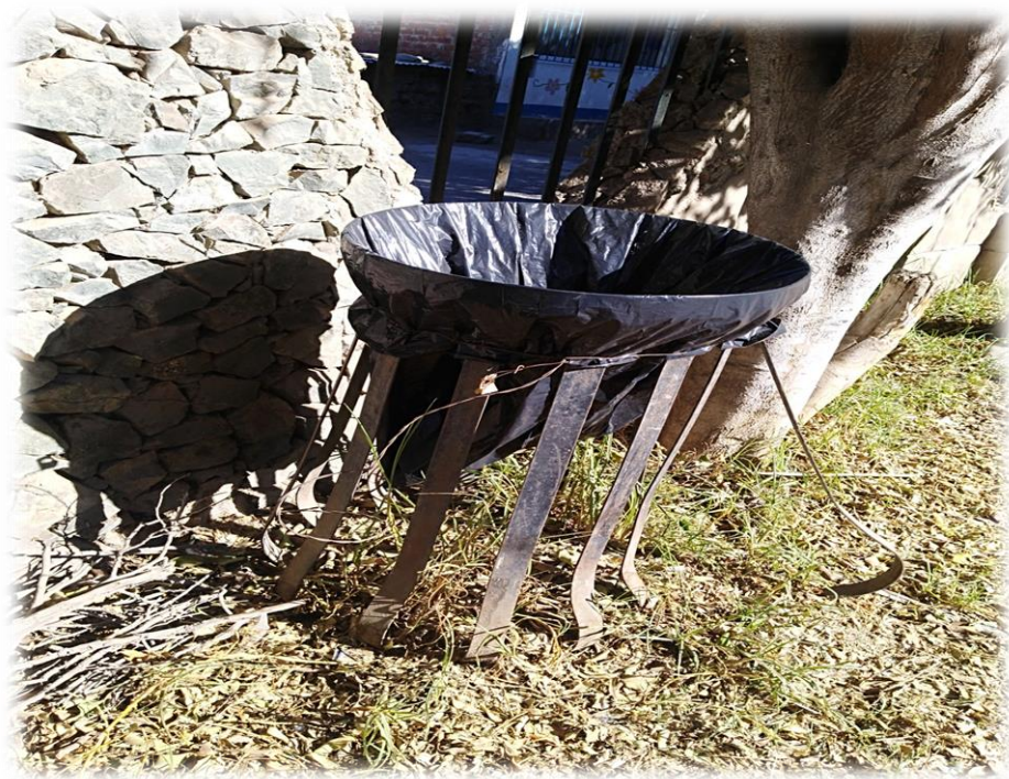
Tachos de basura improvisados – Pariacaca.