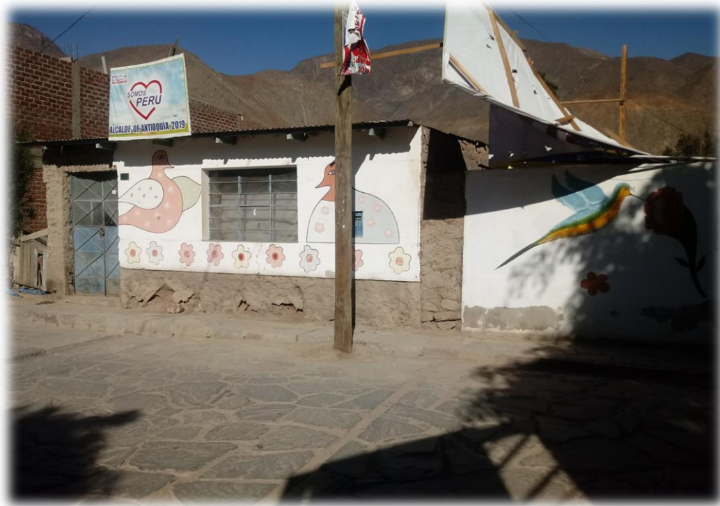
Viviendas de los Pobladores