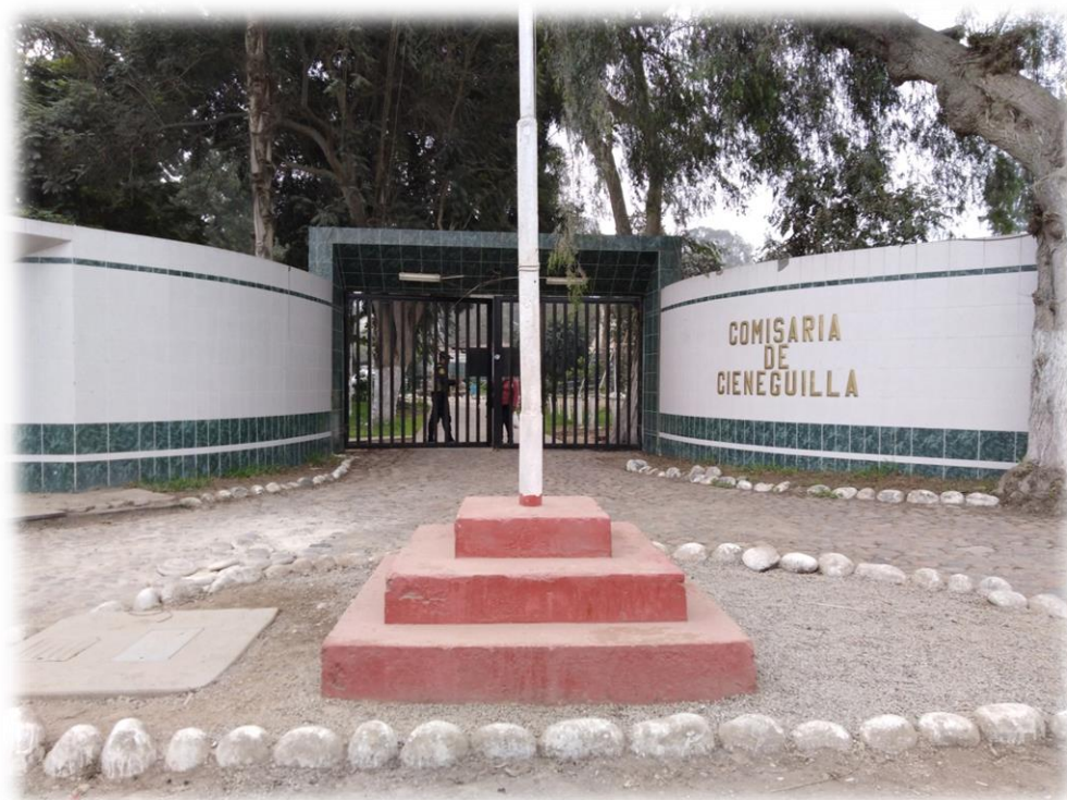
Comisaria de Cieneguilla.