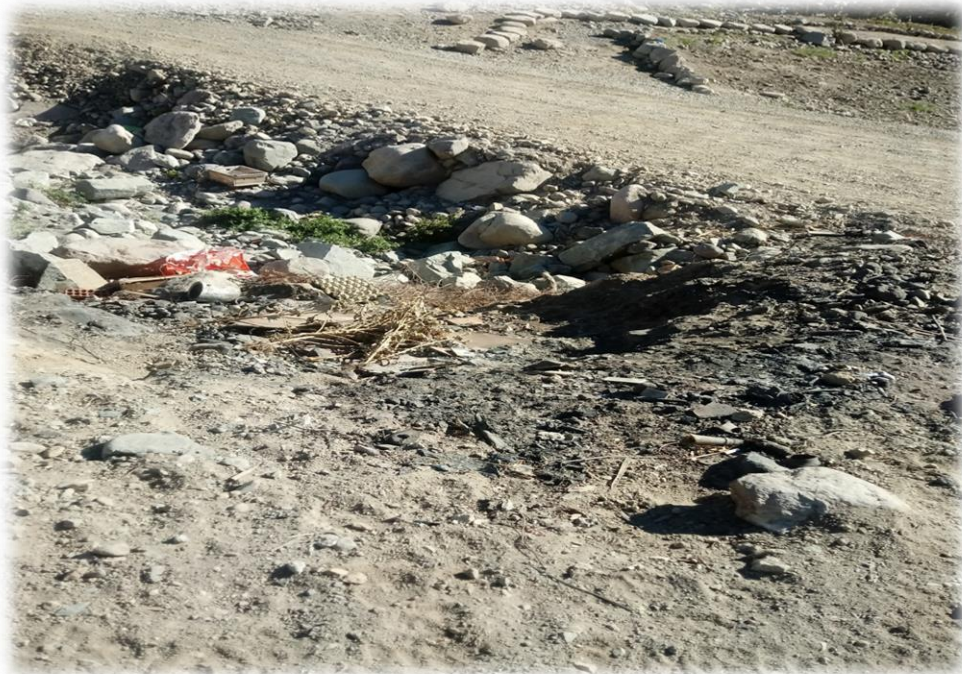
Quema de basura.