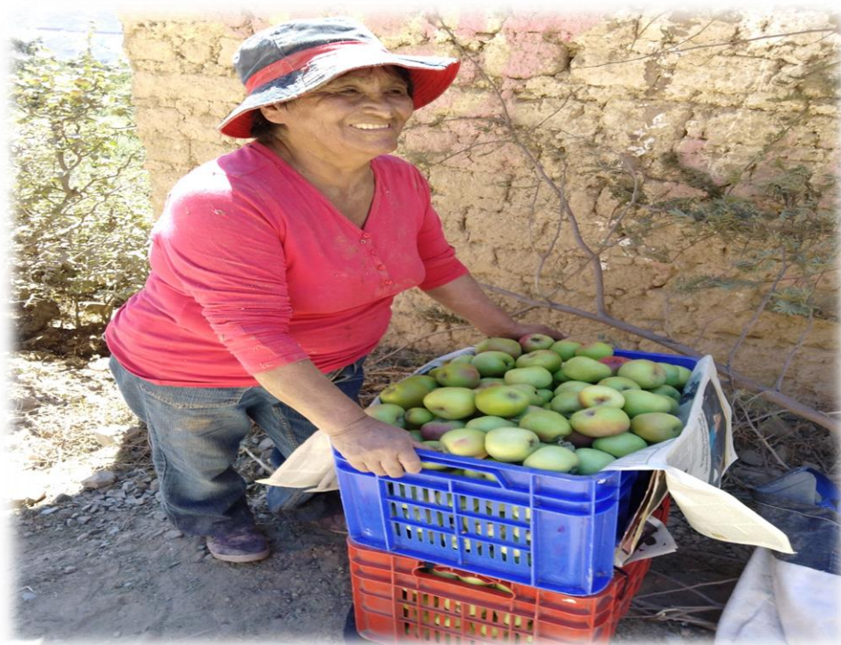
Cosecha de manzanas.