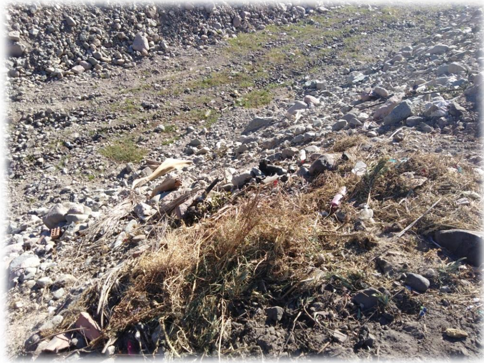
Desmontes que contaminan el rio.