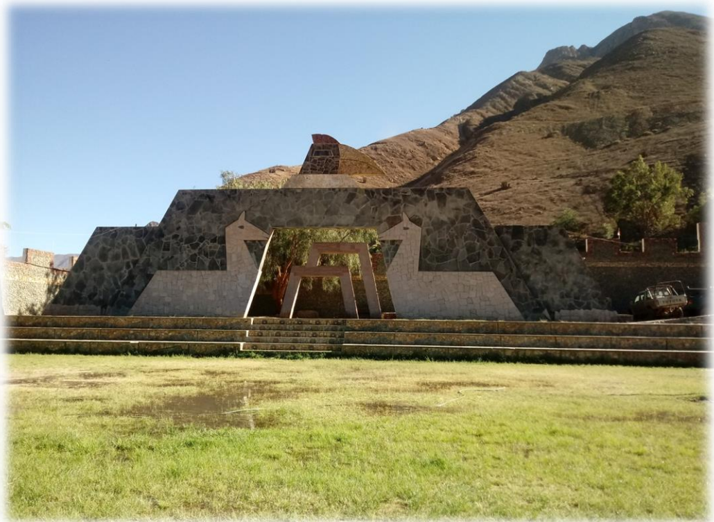
Atractivo turístico el Pariacaca.