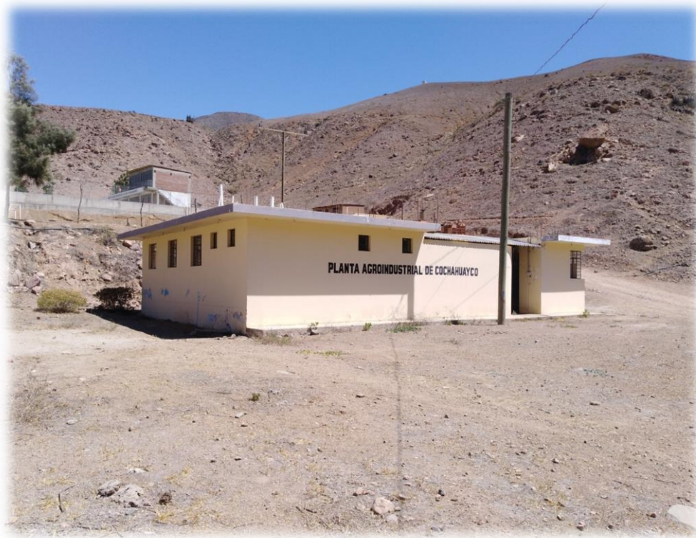
Planta Agroindustrial en abandono - Cochahuayco.