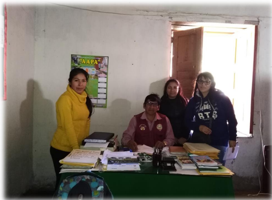
Las Investigadoras y el subprefecto.