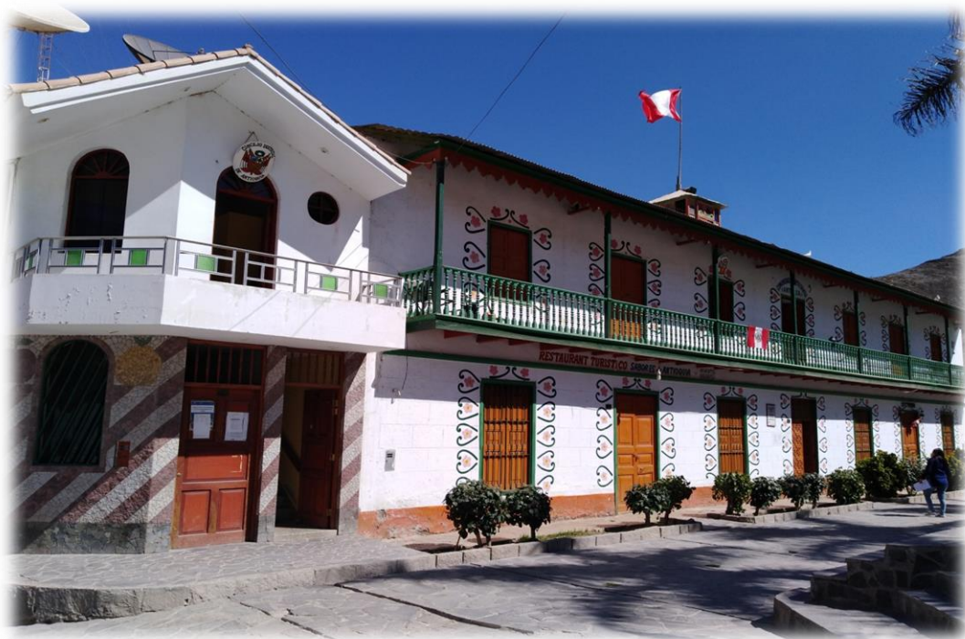
Oficina de la Municipalidad y la Gobernación