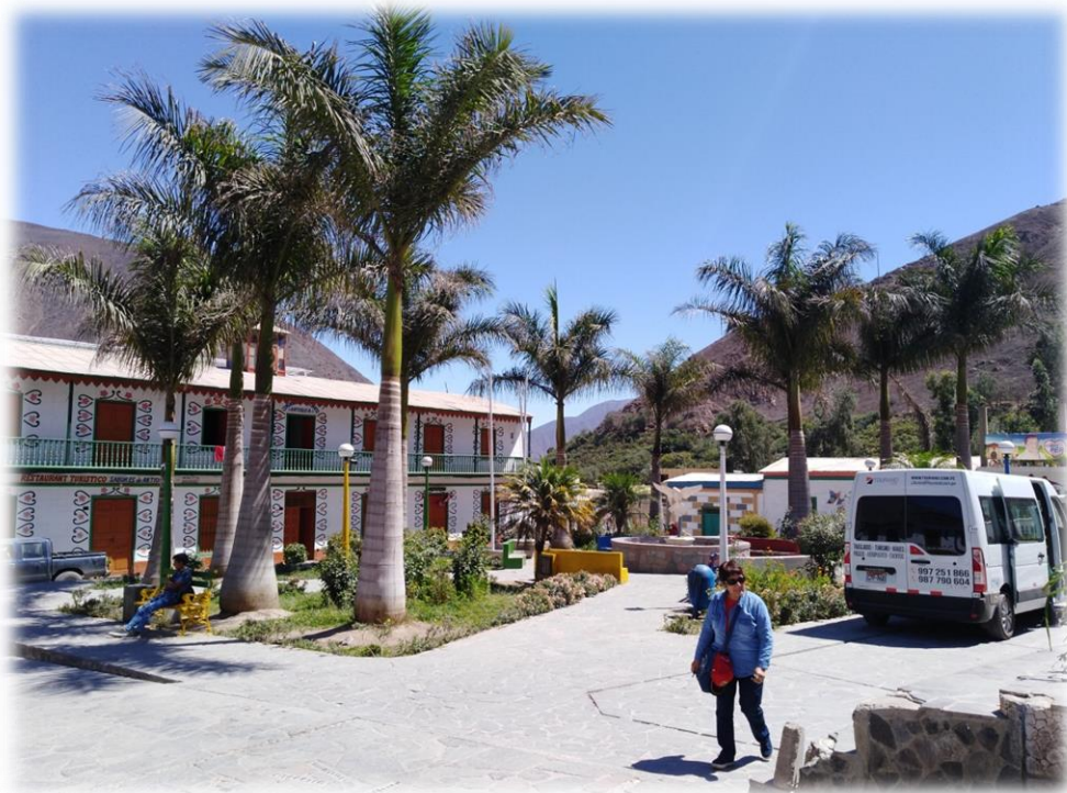
Plaza central de Antioquia.