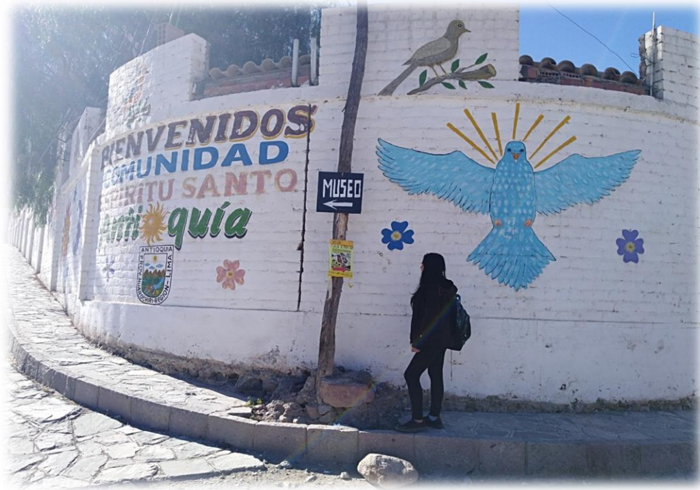
Entrada al museo