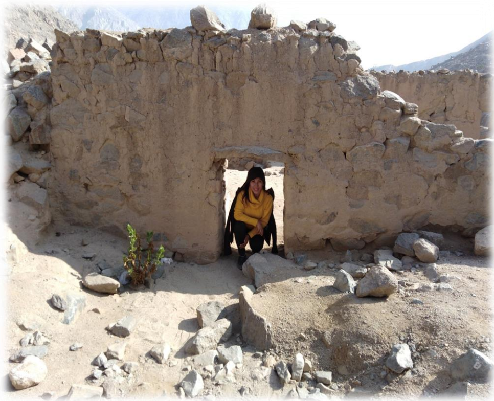
Investigadoras en la zona arqueológica