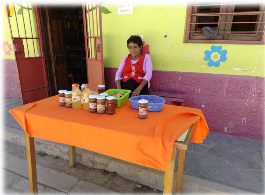
Productos de la localidad de Antioquia.