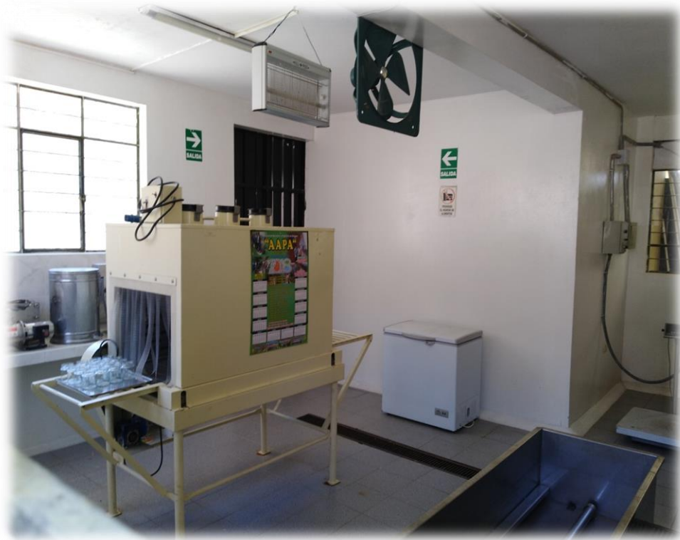
Maquinaria de elaboración de productos.