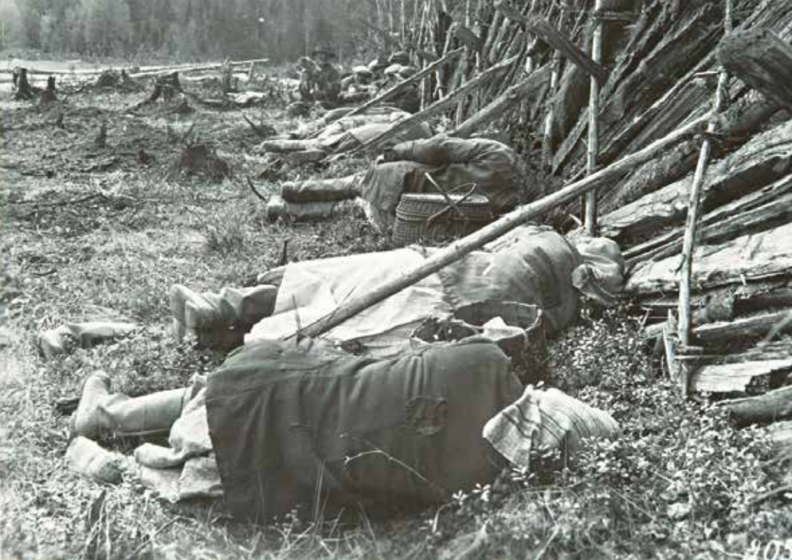
Kaskiviljelijät ruokalevolla, Maaningan Tuovilanlahdella vuonna 1928. Museovirasto, kuvaaja Ahti Rytkönen, 1928.

Muutokset kumpusivat osaltaan yhteiskunnan tilanteesta: esimerkiksi sisällissota ja 1930-luvun lama heikensivät toimeentuloa ja vähensivät avioitumista. Lapsiluvun säännöstely ja perhesuunnittelu voidaankin nähdä selviytymisstrategioina. 24 Perhesuunnittelun yleistyminen ei kuitenkaan ollut vain reagointia muuttuneisiin olosuhteisiin, vaan myös imeväiskuoleisuuden väheneminen vaikutti syntyneisyyden alenemiseen. 25