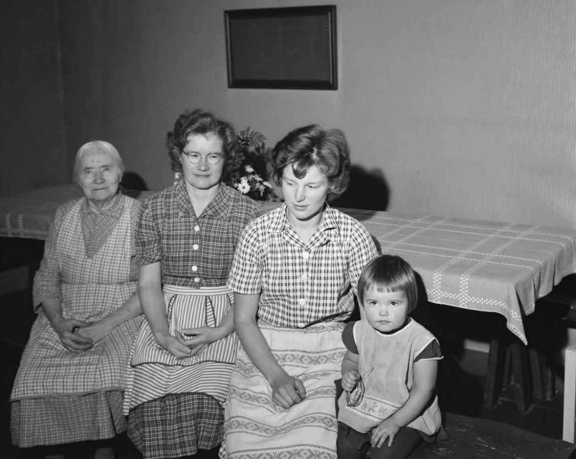
Tuvan penkillä istuu neljä sukupolvea Merjeslammen tilan naisia, Heinolan Imjärvellä.

Naimattomuuteen liittyi kuitenkin myös epäilyttävyyttä. Naimattomien naisten esitettiin kilpailevan miehistä avioliittomarkkinoilla ja aiheuttavan epävakautta jo solmituissa avioliitoissa. 65