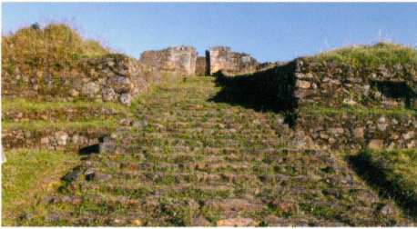
Frontis de ushnu y escalinatas, Aypate - Piura

El Proyecto Qhapaq Ñan inició sus actividades en el año 2001 con el objetivo de identificar y registrar los caminos incas, partiendo de la revisión de estudios previos. Esta labor comenzó diseñando y definiendo algunos criterios metodológicos para la ejecución del proyecto sobre la base de la experiencia del personal técnico en el reconocimiento de caminos incas, labor que continúa a la fecha con mayor dedicación y gracias al conocimiento adquirido por nuestros arqueólogos a lo largo de todos estos años.