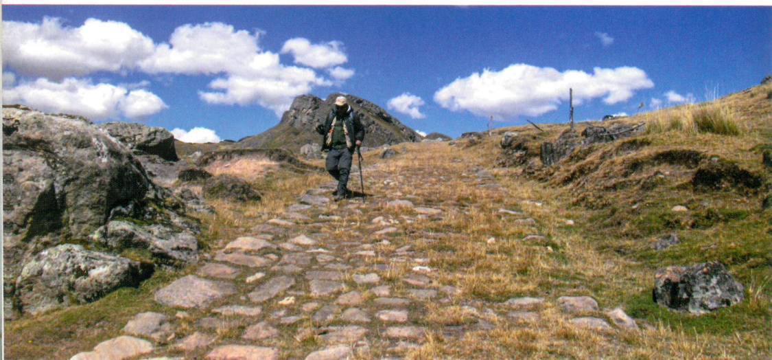
Camino en Vilcabamba, Pasco

El complejo legado histórico del Perú se remonta a miles de años de antigüedad. Poseemos una riqueza cultural que, sin embargo, pocas veces ha sido considerada como fuente de desarrollo para la sociedad actual. No obstante, el patrimonio cultural dinamiza la actividad económica con la consecuente generación de empleos relacionados. Así, la comunidad obtiene la oportunidad de contribuir a su desarrollo social y económico.