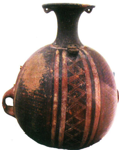
Cerámica inca en Museo de Peañas, Tacna

Por su parte, el Código Penal Peruano, en su título VIII y entre los artículos 226° y 231° señala cuáles son los delitos contra nuestro patrimonio cultural y las penas correspondientes.