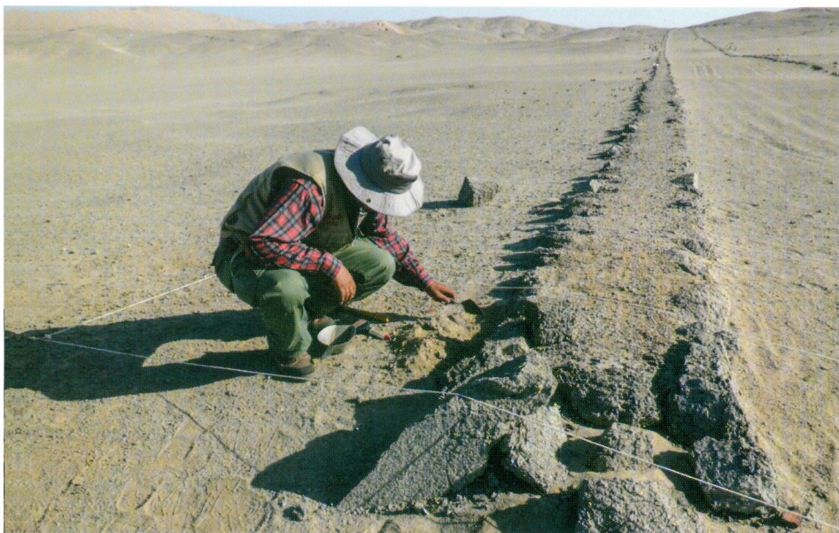
Excavación arqueológica en el Camino Inca de Pampa Antival, Casma - Ancash

La arqueología estudia las sociedades antiguas a partir de sus restos materiales, es decir, la observación de la actividad humana mediante el análisis de los restos físicos del pasado en la búsqueda de una visión general del comportamiento humano.