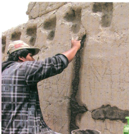
Conservación de frisos en Molle, Lurín - Lima

El trabajo de conservación debe ser permanente, pues se debe atender las reacciones efectuadas en la arquitectura, debido principalmente a los cambios de temperatura y humedad ambiental. El trabajo de conservación debe ser permanente.