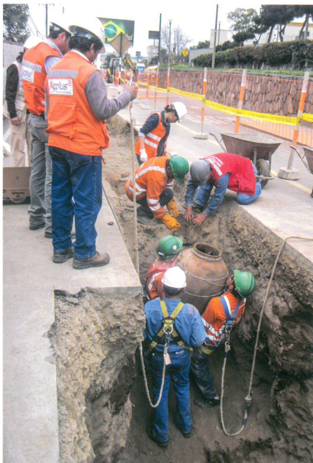
Hallazgo en excavación para tubería de gas

En el caso de encontrarse evidencias culturales subyacentes en el área monitoreada durante el control y supervisión permanente, la recuperación de estas evidencias o “hallazgos fortuitos” se realizará en cumplimiento de las normas y legislación vigente.