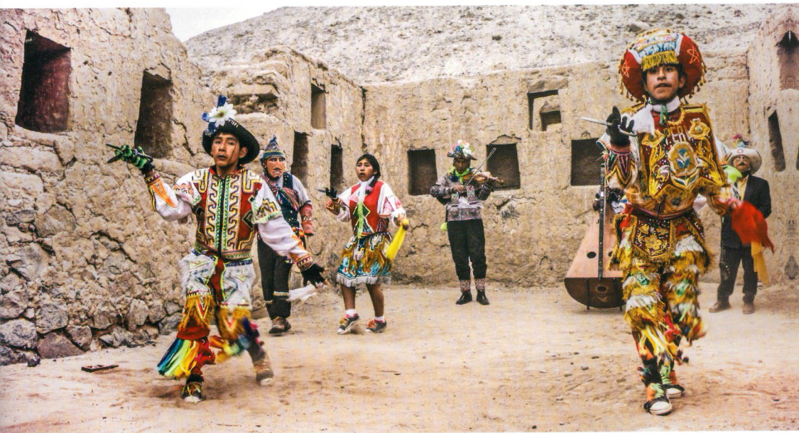
Danzantes de tijeras en el sitio arqueológico Tambo Colorado, Pisco - Ica

El Patrimonio Cultural de la Nación comprende un conjunto de elementos que caracterizan a las manifestaciones culturales y los bienes muebles o inmuebles producto de la actividad humana como por ejemplo costumbres, tradiciones, arquitectura, cerámica, entre otros.