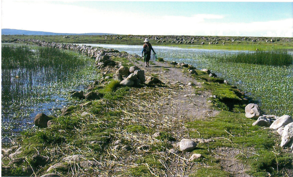
Camino elevado, Pomata - Puno

Todos los peruanos debemos proteger los monumentos arqueológicos. La protección de los sitios debe ser coordinada con todos los miembros e instituciones de la sociedad civil: colegios, universidades, sindicatos, asociaciones, organizaciones comunales, empresas privadas, etc.