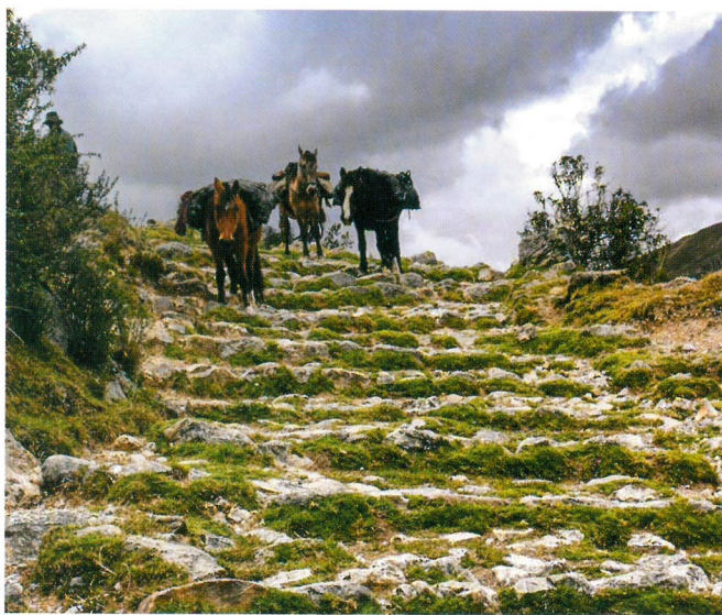
Camino con escalinatas , La Unión - Huánuco

La declaratoria del Qhapaq Ñan como patrimonio mundial significa el reconocimiento a nivel internacional de esta obra maestra de ingeniería, gracias a su valor universal excepcional, propiciando su preservación, conservación, protección y revalorización, así como de las expresiones culturales asociadas al camino, mediante la gestión participativa de las comunidades aledañas y el Estado. Además del reconocimiento a su gente, a sus tradiciones ancestrales, patrones de uso, valores y principios.