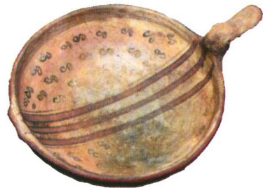
Cerámica inca, Museo de Peñas, Tacna