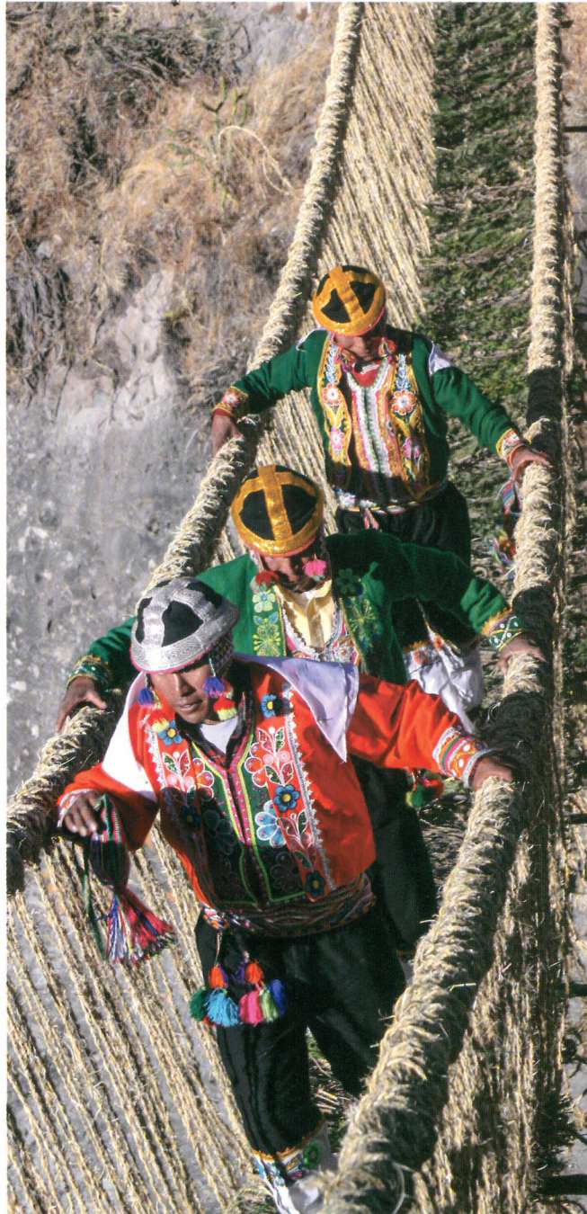
Puente Q'eswachaka, Cusco

Actualmente, el Qhapaq Ñan sigue articulando redes de comunicación, producción e intercambio entre las comunidades que se trasladan por él. Se trata, por tanto, de un patrimonio vivo que a la vez se constituye como una oportunidad para que los pueblos contemporáneos puedan seguir construyendo su futuro.