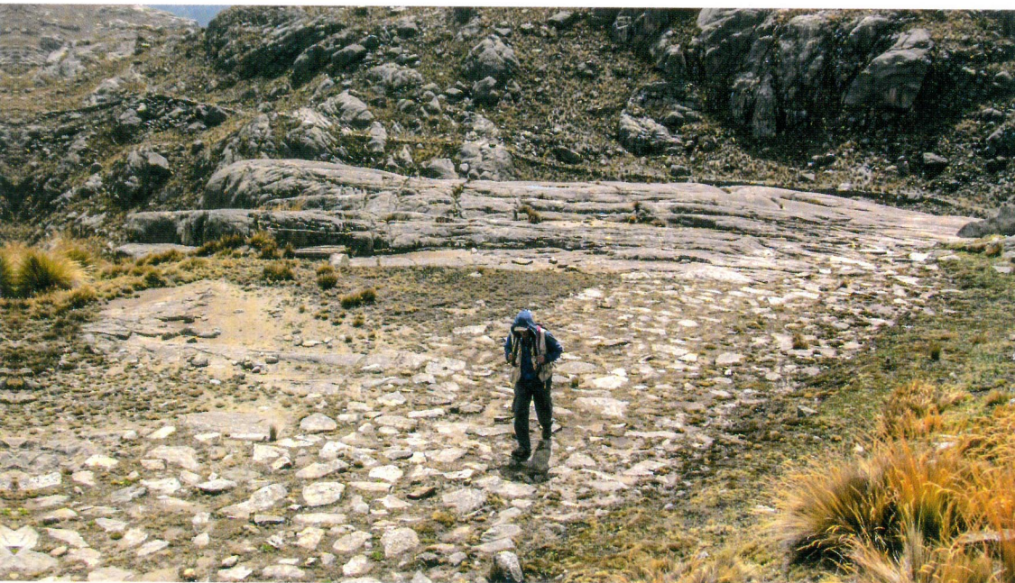
Camino en el Pariacaca, Lima