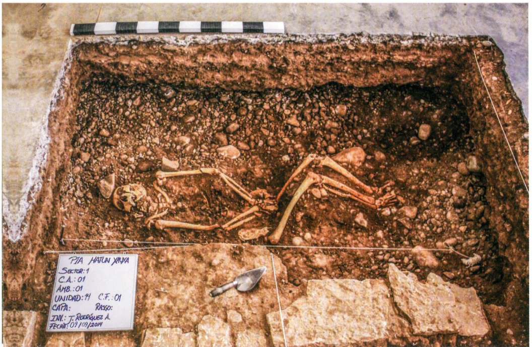
Contexto funerario, ushnu en Xauxa, Junín

El contexto en arqueología refiere a la relación que tienen los objetos entre ellos y la situación en la que fueron hallados. Cada artefacto que se encuentra en un sitio arqueológico tiene una ubicación definida con precisión. Este punto se registra antes de ser retirado de ese lugar. Cuando se retira un objeto sin dejar constancia de su ubicación precisa, el contexto se ha perdido para siempre, y el artefacto tiene poco o ningún valor científico. El contexto es lo que permite a los arqueólogos entender la relación entre los artefactos en el mismo sitio, así como para establecer la relación de los sitios arqueológicos entre sí.