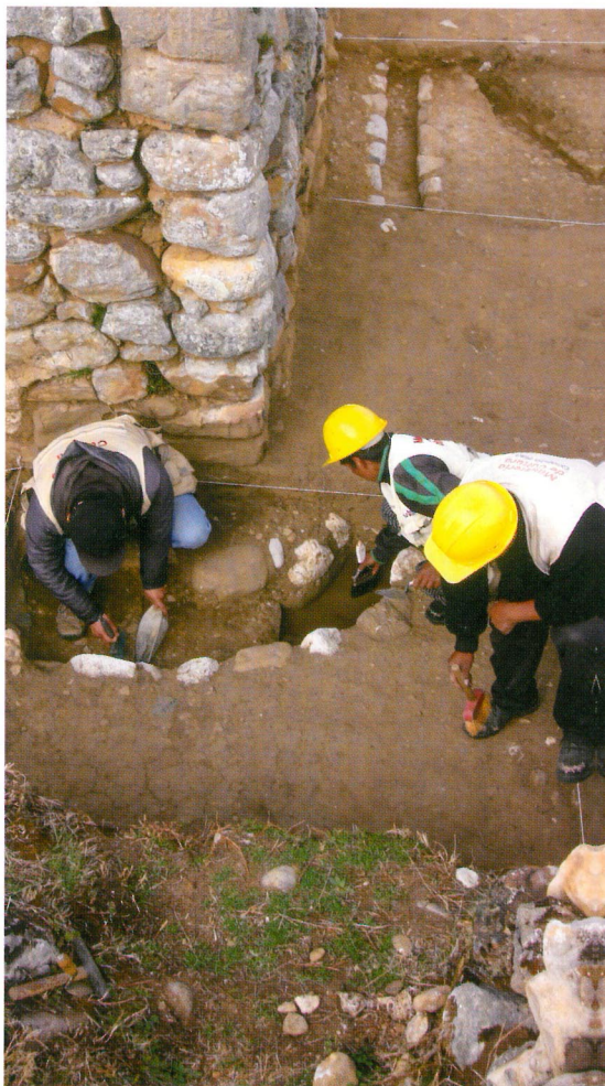
Excavación en Huánuco Pampa, Huánuco

En el caso de la identificación, registro, conservación, protección y puesta en valor del sistema vial inca o Qhapaq Ñan, el marco legal específico del Decreto Supremo N° 031-2001-ED, declara de interés nacional la investigación, identificación, registro, conservación y puesta en valor de la red de caminos incas dentro del territorio nacional.