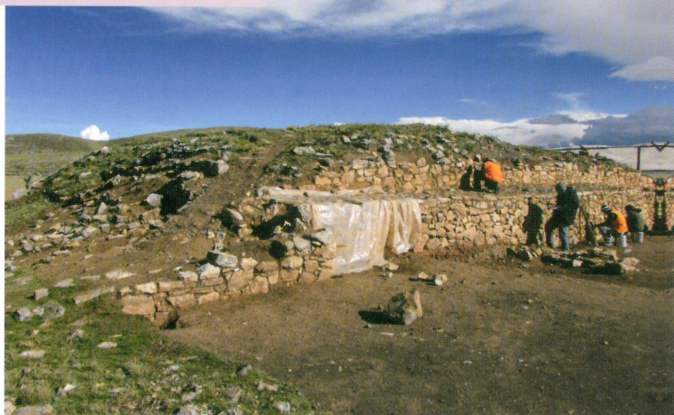
Trabajos de conservación en Pumpu, Pasco

Implica realizar los trabajos de restauración y consolidación de la arquitectura arqueológica, y así proteger sus principales estructuras de las condiciones climáticas, ambientales o antrópicas que afecten su preservación.