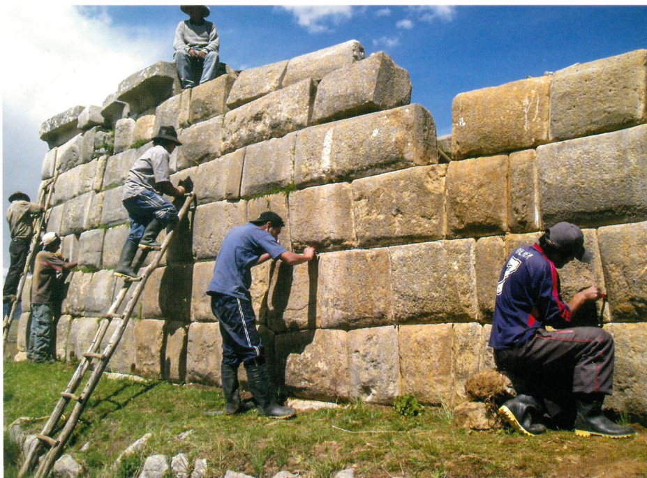
Trabajo de puesta en valor, ushnu de Huánuco Pampa, Huánuco