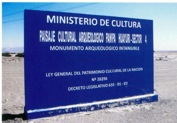
Panel de señalización

La participación de arqueólogos en este tipo de proyecto tiene como objetivo monitorear el trabajo de campo e implementar las medidas de protección adecuadas, a fin de velar por la integridad del patrimonio arqueológico presente en el área del proyecto, durante las distintas fases de ejecución.