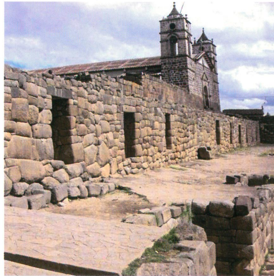
Iglesia San Juan Bautista, Vilcashuamán - Ayacucho

El patrimonio arqueológico es nuestra herencia cultural, constituida por todas las evidencias de generaciones pasadas que han quedado plasmadas en el variado paisaje del territorio nacional. Entre estas tenemos zonas ceremoniales, de habitación, caminos y distintos objetos creados por el ser humano, antes de la aparición de la escritura.