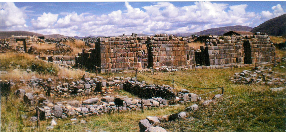
Incahuasi de Huánuco Pampa, Huánuco

El complejo legado histórico del Perú se remonta a miles de años de antigüedad. Poseemos una riqueza cultural que, sin embargo, pocas veces ha sido considerada como fuente de desarrollo para la sociedad actual. No obstante, el patrimonio cultural dinamiza la actividad económica con la consecuente generación de empleos relacionados. Así, la comunidad obtiene la oportunidad de contribuir a su desarrollo social y económico.