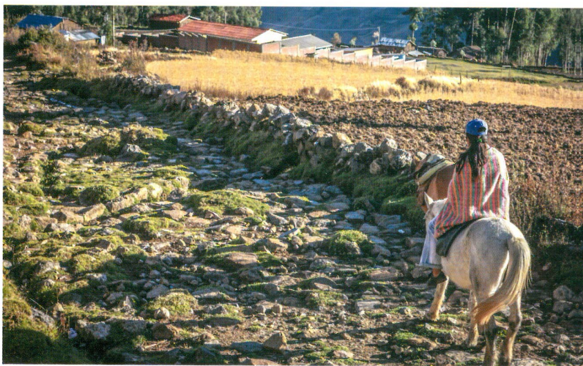
Camino en Huari, Ancash

Por esta razón debe ser defendido y protegido, para que se mantenga a posteridad y garantizar la transmisión de su legado a las generaciones futuras. Asimismo se debe tener en cuenta que nuestro patrimonio es un recurso no renovable, es decir, que una vez utilizado no podrá ser reemplazado, por lo que aún la investigación arqueológica considera su preservación para futuros estudios.