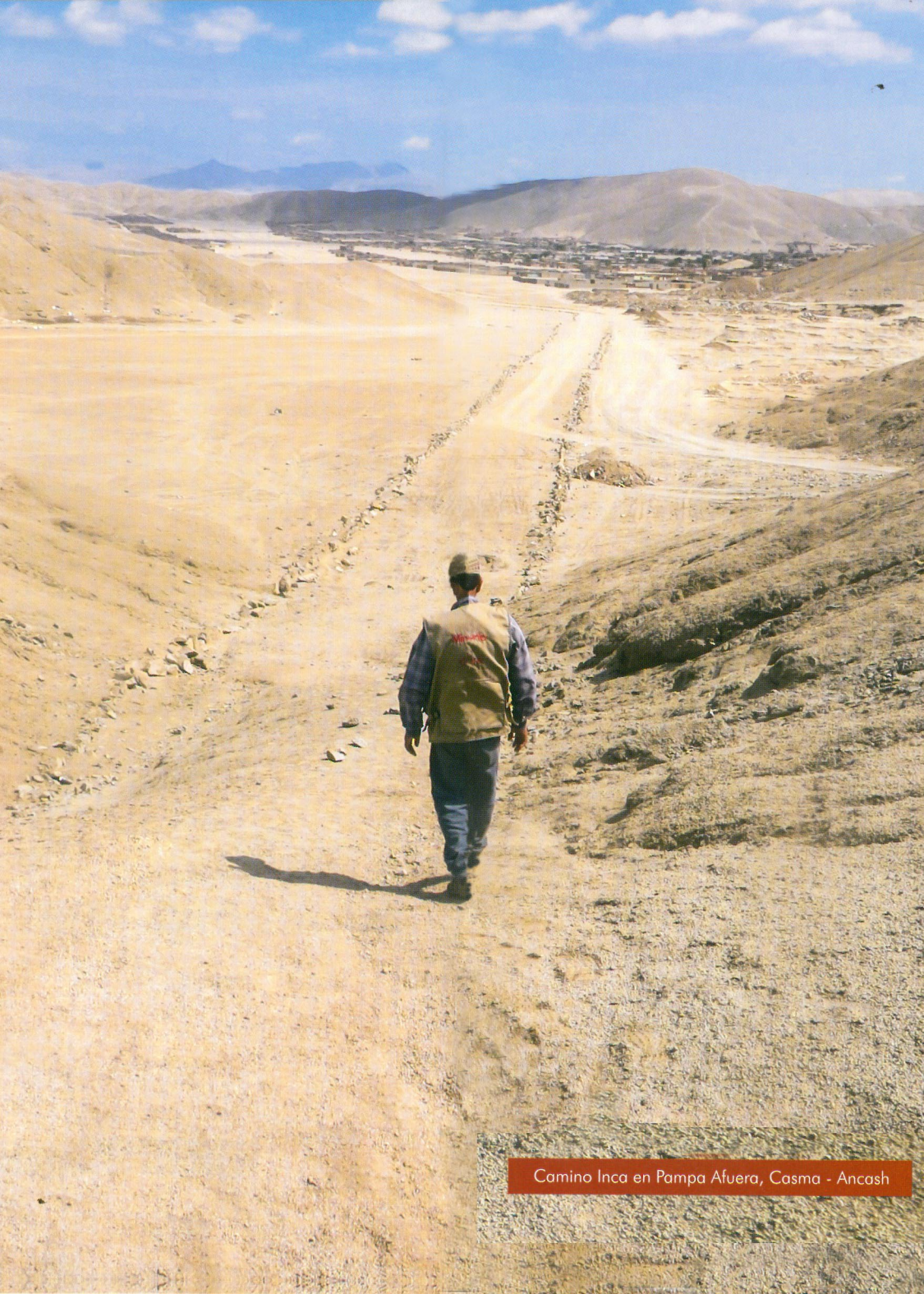
Camino Inca en Pampa Afuera, Casma - Ancash