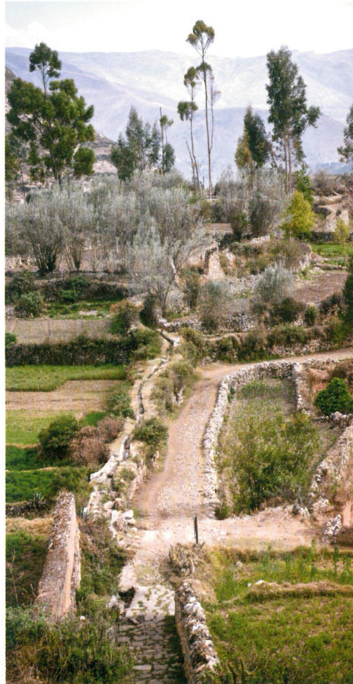
Camino en Tarmatambo, Junín