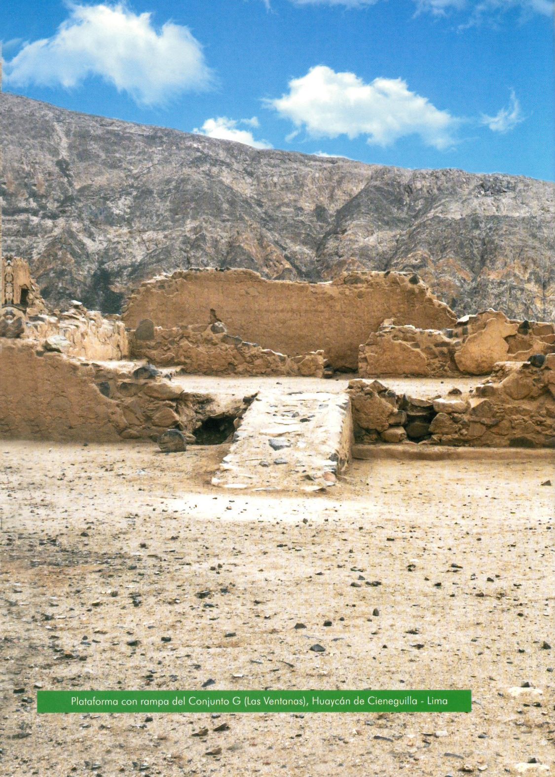
Plataforma con rampa del Conjunto G (Las Ventanas), Huaycán de Cieneguilla - Lima