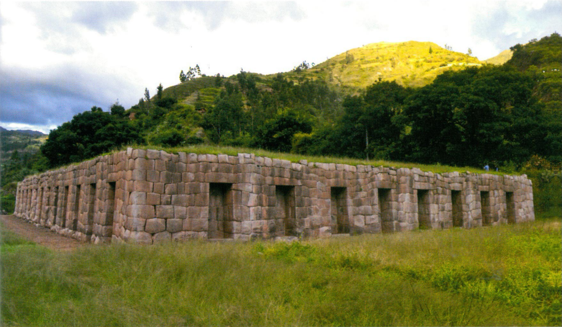
Plataforma inca en Limatambo, Cusco

Un sitio arqueológico es cualquier lugar donde existan restos físicos de actividades humanas del pasado. Existen muchos tipos de sitios arqueológicos, incluyendo aldeas permanentes, canteras de piedra de las que se obtuvieron materia prima, petroglifos y pinturas rupestres, cementerios, campamentos temporales, estructuras monumentales, entre otros. Un sitio puede ser tan pequeño como un grupo de herramientas de piedra tallada de un cazador que se detuvo para afilar una punta de lanza, y tan grande como los complejos asentamientos prehispánicos.