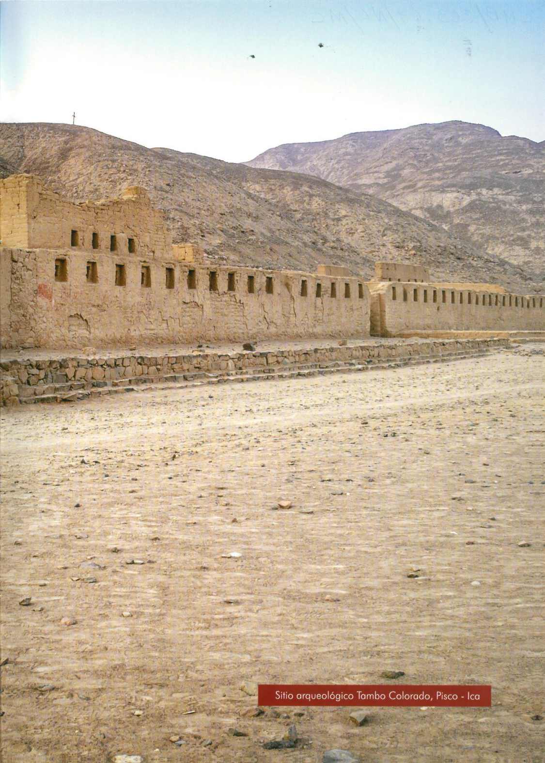
Sitio arqueológico Tambo Colorado, Pisco - Ica