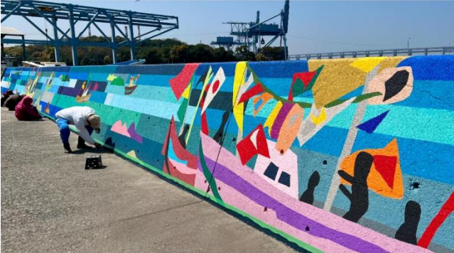
図 13-16: 会場風景