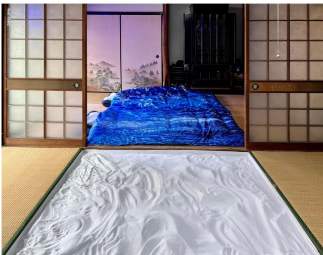
図10：砂浜の間(手前)、海洋の間(奥)

砂浜の間では畳をあげた2帖に白砂を敷詰めた。入口の土間から俯瞰すると白浜越しに布団の海。その奥には元々の襖の松浜が借景となる。砂は自由に触ってもらったので、大人も子供も童心に帰って一心に砂遊びにふけていた。