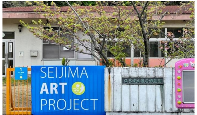
(上) 図3、(下) 図4：会場・瀬居幼稚園

使用したボタンは合計で約6万個。素材は金属、木材、プラスチック、貝など。不要のボタンは時代も生産地も違い、様々な人が使用したものである。作品が大きいと驚く人と珍しいボタンを見つけて楽しむ人が多かった。会場に置いた感想ノートやアンケート葉書には多くのコメントが寄せられた。