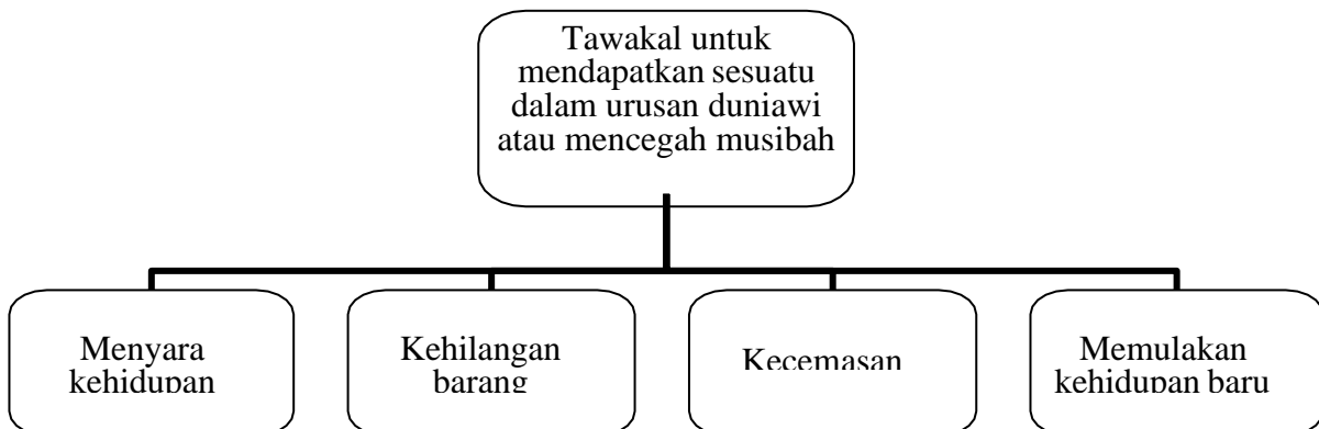
Rajah 2: Aspek-aspek Tawakal dalam Travelog Biniku Ninja

Melalui proses pembacaan secara mendalam dan teliti pada travelog Biniku Ninja , pengkaji telah mendapati bahawa analisis kajian lebih sesuai dijalankan pada jenis tawakal untuk mendapatkan sesuatu dalam urusan duniawi atau mencegah musibah. Rajah berikut merupakan antara aspek-aspek tawakal dalam travelog Biniku Ninja yang bersesuaian dengan jenis tawakal tersebut: