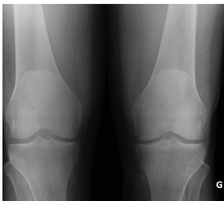
Figure 1: radiographie de face des deux genoux montrant la position anormalement haute des 2 rotules