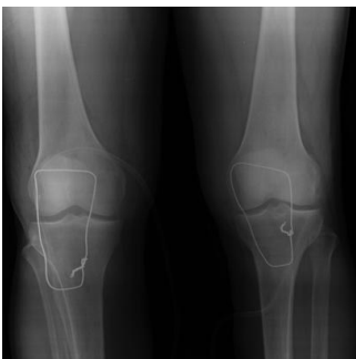
Figure 4: radiographie de face après réparation du tendon rotulien et protection par cadrage, les deux rotules sont au même niveau