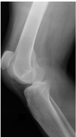
Figure 3: radiographie de profil du genou gauche objectivant la patella alta