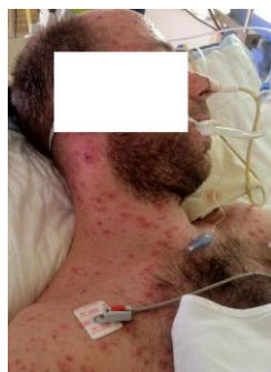
Figure 1: éruption érythémato-vésiculeuse prurigineuse au niveau du thorax et la face