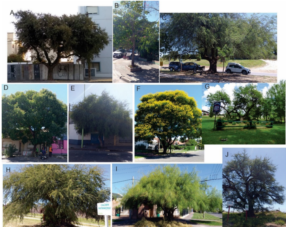
Figura 3. Árboles seleccionados para el estudio

Referencias: A. Jodina rhombifolia , B. Handroanthus ochraceus , C. Neltuma caldenia , D. Schinopsis lorentzii , E. Schinus fasciculatus , F. Peltophorum dubium , G. Neltuma flexuosa , H. Neltuma caldenia , I. Parkinsonia acuelata , J. Neltuma caldenia .