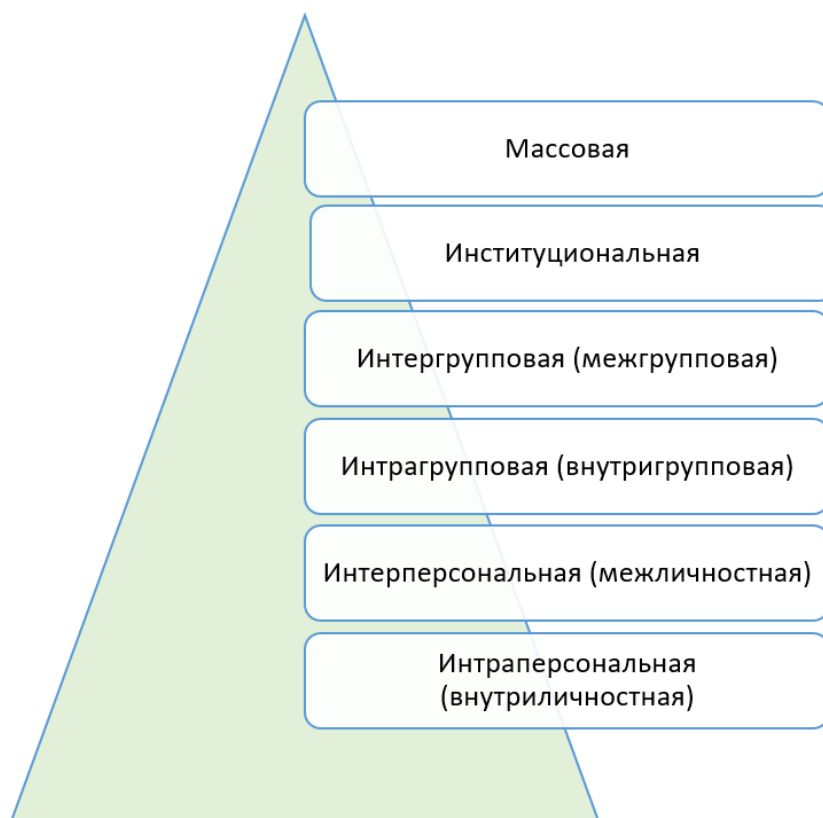
Рис. 1. Пирамида коммуникации по МакКуэйлу [17, с. 18] Fig. 1. Communication pyramid (McQuail D., 2010, [17, p. 18])

5) институциональный/организационный (политическая система, коммерческая фирма);