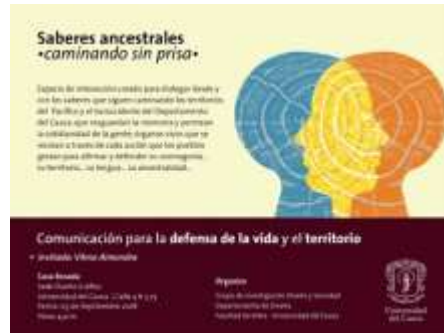
Figura 2. Diseño promocional: Encuentro con Vilma Almendra

Diagramación: Lina Durán y Juliana Sarmiento, 2018. Semillero Imagen ConTexto.