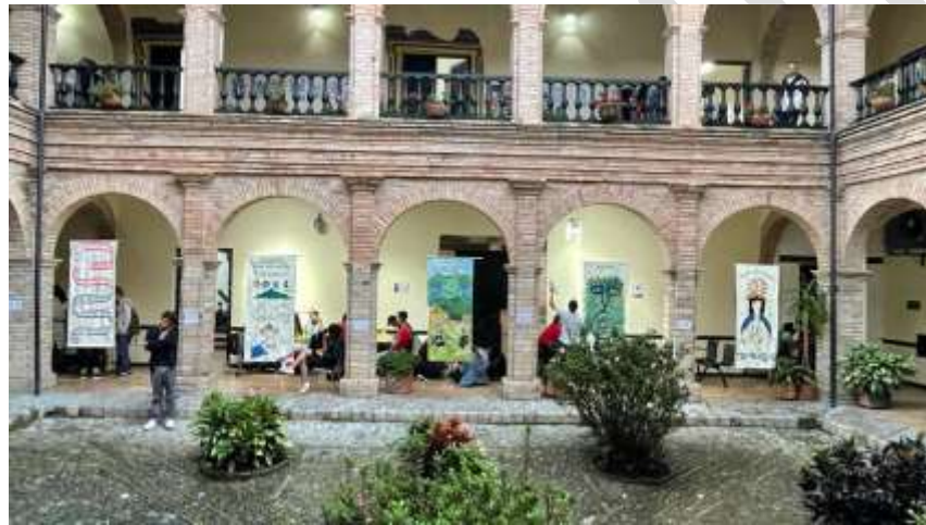
Figura 5. Exposición de pósteres de Comunicación y Territorio

Fotografía: estudiante, Gustavo Blanco. Asignatura Comunicación y Territorio 2022. Programa diseño gráfico. Unicauca.