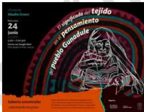
Figura 3. Diseño promocional: encuentro con Abadio Green

Fuente: Grupo de investigación diseño&sociedad. Diagramación: estudiante Milena Calpa. Semillero Imagen ConTexto, 2020.