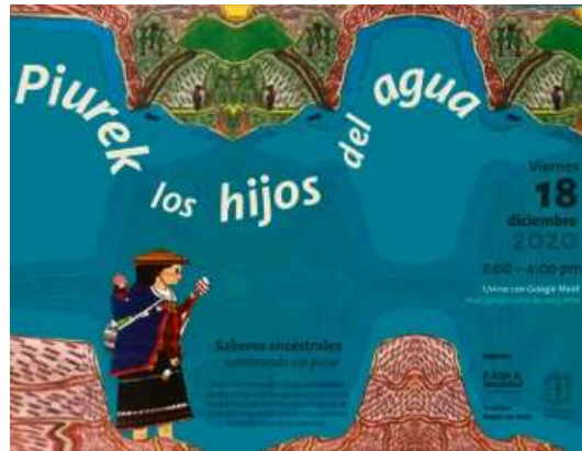
Figura 4. Diseño promocional: encuentro con Bárbara Muelas

Diagramación: estudiante Milena Calpa. Semillero Imagen ConTexto, 2020.