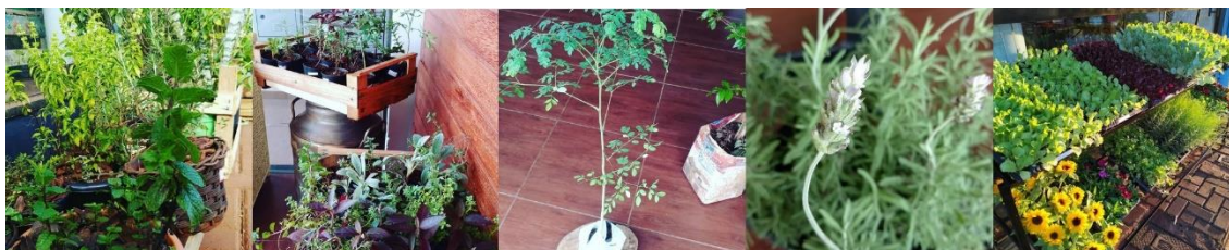
Figura 6 - Exemplo prático do processo de aprendizagem da extensão universitária com plantas medicinais e aromáticas consolidado no ambiente profissional de um ex-aluno bolsista e hoje proprietário de loja agropecuária.

diversas plantas medicinais e aromáticas (hortelã, alecrim, manjeriço), além de suculentas, hortaliças e outras plantas ornamentais (Figura 6).