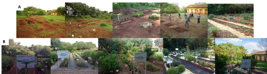
Figura 3 - Implementação do Horto de plantas medicinais, aromáticas e condimentares da UFPR Setor Palotina, desde 2010 (A) até 2021 (B) como espaço de fortalecimento das atividades de extensão, pesquisa e ensino.

O Horto do Setor Palotina da UFPR é um espaço que conserva a biodiversidade e a utiliza, além da extensão, para atividades didáticas e de investigação científica. O Horto é como um jardim botânico, pois recebe visitas de pessoas ou grupos de toda a região e configura-se como espaço-ciência (Figura 3). Entre os grupos de visitantes que já foram recebidos no Horto estão, por exemplo, inúmeros alunos de escolas/colégios públicos e particulares, calouros dos cursos de graduação, turmas de catequese, representantes do Comitê Gestor de Plantas Medicinais da Bacia do Rio Paraná 3, representantes da Pastoral da Criança, grupos atendidos pelo Núcleo de Saúde da Família de Palotina (NASF), senhoras do Rotary Club, representantes de cooperativas locais, e moradores da cidade.