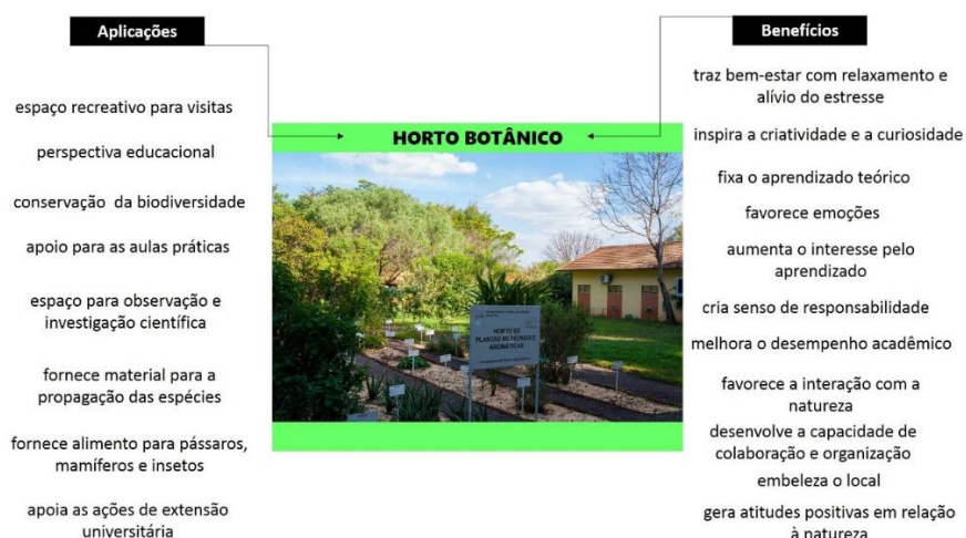
Figura 4 - O horto botânico como espaço educacional apresenta diferentes aplicações e inúmeros benefícios.

O estabelecimento de hortos botânicos como centros educativos cria benefícios semelhantes aos decorrentes do envolvimento dos estudantes com as hortas escolares: aumento do interesse em aprender, melhoria do desempenho acadêmico, desenvolvimento da capacidade de colaboração e organização, responsabilidade, paciência e espírito de equipe, um sentimento de propriedade e atitudes positivas em relação à natureza. Assim, estas áreas podem tornar-se valiosos locais de educação e investigação, inspirando criatividade e emoções agradáveis; servindo também como espaços recreativos (BLASZAK et al., 2019). Desta forma, os espaços possuem diferentes aplicações e inúmeras vantagens que estão destacadas na Figura 4.