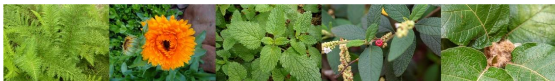
Figura 5 - Representação de algumas espécies medicinais, que também são aromáticas, condimentares e/ou alimentícias não convencionais presentes no Horto do Setor Palotina da UFPR. Da esquerda para a direita: mil-folhas, calêndula, melissa, erva-baleeira e panaceia.

O Horto conta atualmente com mais de 85 espécies vegetais de plantas medicinais, algumas das quais são ainda aromáticas, condimentares, alimentícias não convencionais (PANC) e ornamentais (Figura 5). As mudas foram obtidas em casas de amigos, familiares, compradas ou por meio de doações através de parcerias com outras instituições como o Centro Popular YANTEN (Medianeira, PR) e o projeto Plantas Medicinais do Programa Cultivando Água Boa da Itaipu Binacional (Foz do Iguaçu, PR), em eventos como as feiras agropecuárias da C.Vale Cooperativa Agroindustrial (PAULERT et al., 2020), em atividades em parceria com a prefeitura municipal de Palotina-PR, ou através dos visitantes. A partir das espécies cultivadas no Horto, muitas mudas foram produzidas anualmente em embalagens recicláveis para a distribuição gratuita à comunidade em diferentes eventos (PAULERT et al., 2020).