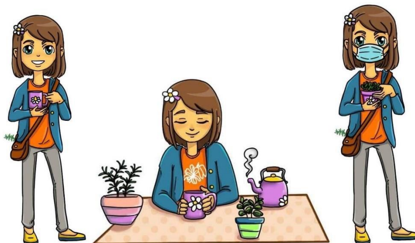
Figura 2 - Mascote Flora que faz parte dos projetos de extensão com plantas medicinais do Setor Palotina da UFPR e foi idealizada para comemorar os 25 anos de atividades.

Fonte: Os créditos são da artista visual Marion Cordeiro Langner que é bolsista de extensão e aluna do curso de ciências biológicas (2021).