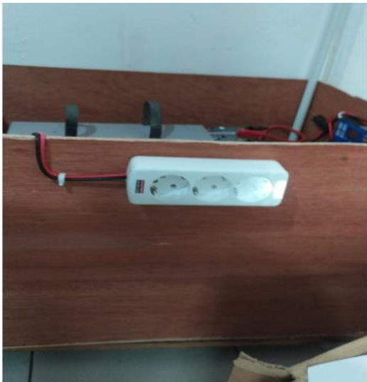
Gambar 3. Catu daya sistem PLTS

Setelah sistem instalasi PLTS terpasang sesuai dengan disain rancangan maka dilakukan tahapan uji coba sistem PLTS apakah bekerja dengan baik atau belum. Tahapan uji coba alat bisa terlihat pada gambar 4. Dari gambar terlihat bahwa sistem PLTS bisa bekerja dengan beberapa jenis beban listrik. Di Kelurahan Plaju darat di gunakan beban-beban listrik seperti Wifi, komputer administrasi Kelurahan, finger print dan printer. Kapasitas inverter yang digunakan sebesar 1000 Watt.