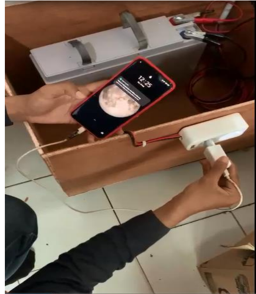
Gambar 4. Ujicoba PLTS

Setelah sistem instalasi PLTS terpasang sesuai dengan disain rancangan maka dilakukan tahapan uji coba sistem PLTS apakah bekerja dengan baik atau belum. Tahapan uji coba alat bisa terlihat pada gambar 4. Dari gambar terlihat bahwa sistem PLTS bisa bekerja dengan beberapa jenis beban listrik. Di Kelurahan Plaju darat di gunakan beban-beban listrik seperti Wifi, komputer administrasi Kelurahan, finger print dan printer. Kapasitas inverter yang digunakan sebesar 1000 Watt.