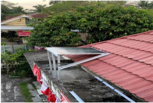
Gambar 2. Panel surya di atap Kelurahan