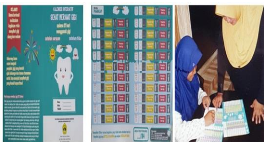
Gambar 5. Kalender Interaktif dan penggunaannya

Dalam rangka pemantauan program sikat gigi selama 21 hari tanpa putus digunakan kalender interaktif. Alat Peraga Kalender Interaktif pemeliharaan kesehatan gigi merupakan alat yang dapat digunakan untuk mengenalkan suatu konsep dengan cara yang mudah, aktif, kreatif, dan menyenangkan (Melo dkk, 2018). Dengan alat peraga ini anak dapat memahami suatu konsep yang ditunjukkan dengan jam; memahami urutan kegiatan sehari-hari; waktu menyikat gigi, menyebutkan nama-nama makanan kesehatan dan sebagainya. Alat Peraga Kalender Interaktif ini terdiri dari berbagai perangkat dengan bahan yang bersifat tahan lama dan aman digunakan oleh anak-anak, serta mudah digunakan (Heriyanto dkk 2018). Kalender interaktif yang digunakan seperti pada gambar 4 berikut :