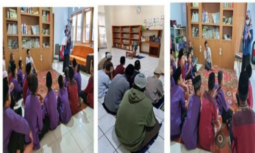
Gambar 3. Penyuluhan tentang kesehatan gigi dan mulut

Penyuluhan ini dilakukan sebanyak 3 kali dengan maksud penambahan pengetahuan dan kemampuan seseorang melalui teknik praktik belajar atau instruksi dengan tujuan mengubah atau mempengaruhi perilaku manusia baik secara individu, kelompok maupun masyarakat untuk meningkatkan kesadaran akan nilai kesehatan gigi dan mulutnya sehingga dengan sadar mau mengubah perilakunya menjadi perilaku sehat. Edukasi diharapkan dapat memberi manfaat yang berkesinambungan dengan sasaran perubahan konsep sehat pada aspek pengetahuan, sikap dan perilaku individu maupun masyarakat.