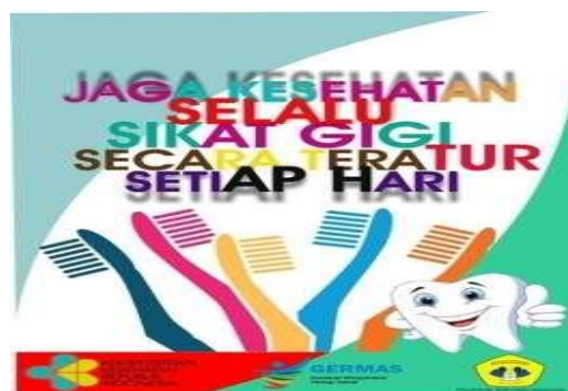
Gambar 2. Poster Kesehatan Gigi dan Mulut

Secara keseluruhan kegiatan program ipteks bagi masyarakat pada anak yang tinggal di Panti Asuhan Cemara dan Pondok Yatim Daarul Aitam yang terdiri dari kegiatan penjajagan dan perizinan, pelaksanaan penyuluhan kesehatan gigi, pembagian kalender interkatif dan sarana menyikat gigi serta masker pada, demonstrasi menyikat gigi dan pemantauan hasil penyuluhan telah dapat dilaksanakan secara baik dan tepat waktu sebagaimana yang telah ditetapkan. Adapun sebagai bentuk luaran dari kegiatan ini, telah dibuat juga satu buah Poster Kesehatan Gigi yang dibuat oleh Mahasiwa Prodi D III Kesehatan Gigi yang terlibat dalam kegiatan ini untuk diberikan kepada masing-masing mitra dapat dilihat pada gambar 1.