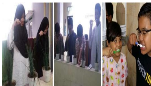
Gambar 4. Kegiatan Implementasi Program Menyikat Gigi Selama 21 hari

Pemeliharaan kesehatan gigi dan mulut dilakukan dengan cara menyikat gigi bersama seminggu sekali dengan bimbingan ustadz, selain itu untuk membiasakan anak menyikat gigi secara rutin maka seluruh anak di Panti Asuhan Cemara dan Pondok Yatim Daarul Aitam menerapkan program sikat gigi selama 21 hari tanpa putus, dengan harapan dalam diri anak akan terbentuk kebiasaan yang baik, disini peran guru pembimbing panti sangat penting. Kegiatan menyikat gigi dapat dilihat pada gambar 3.