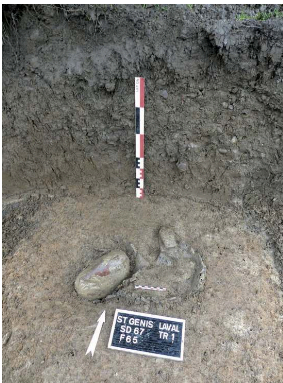
Fig. 1 – Vue du dépôt F 65, avec la céramique néolithique en place