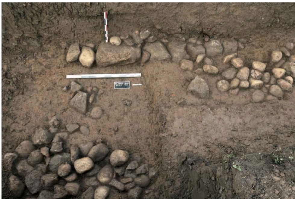
Fig. 3 – Vues de F 36 (aménagement empierré), F 37 (maçonnerie) et de F 38 (amas de galets)