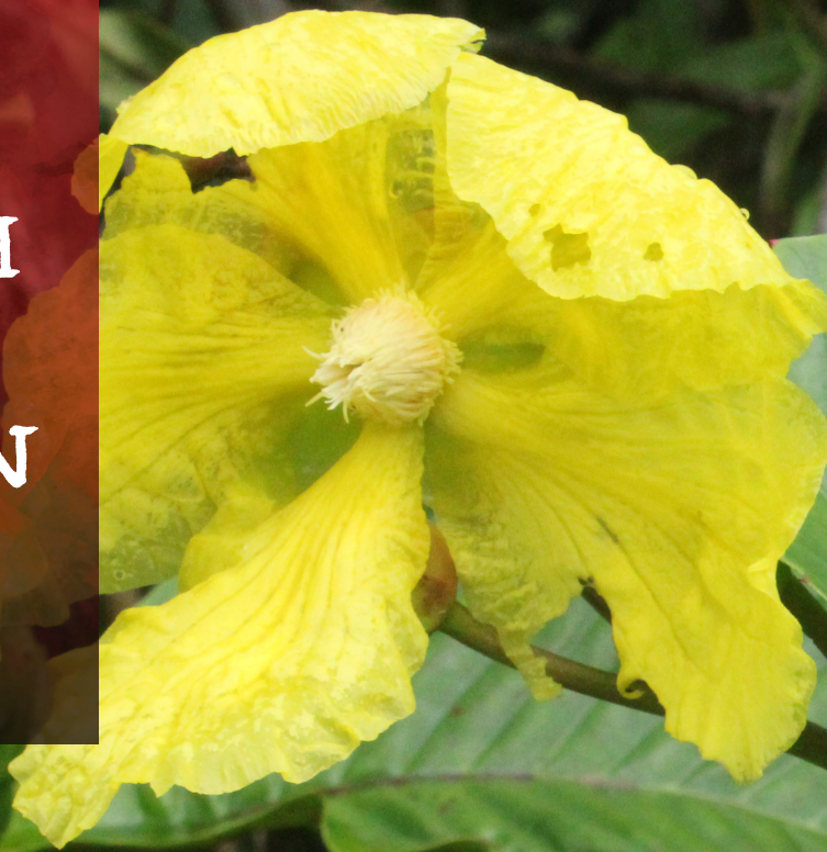
Pokok Simpor ( Dillenia Suffruticosa ).