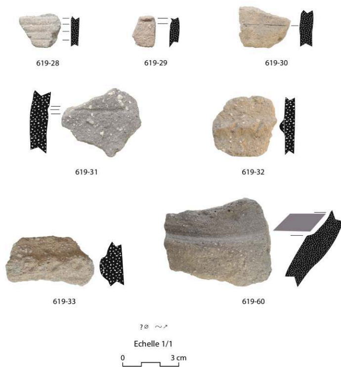
Fig. 3 – Les Neuf Fontaines, Saint-Georges-sur-Allier : vaisselle céramique