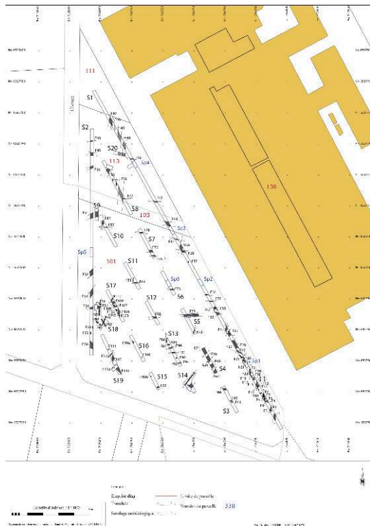
Fig. 1 – Plan général des sondages et des structures observées

l'est. Les sols d'occupations ne sont pas conservés, sauf très localement dans la partie sud. Le mobilier est rare, ce qui laisse un bon nombre de structures non datées.