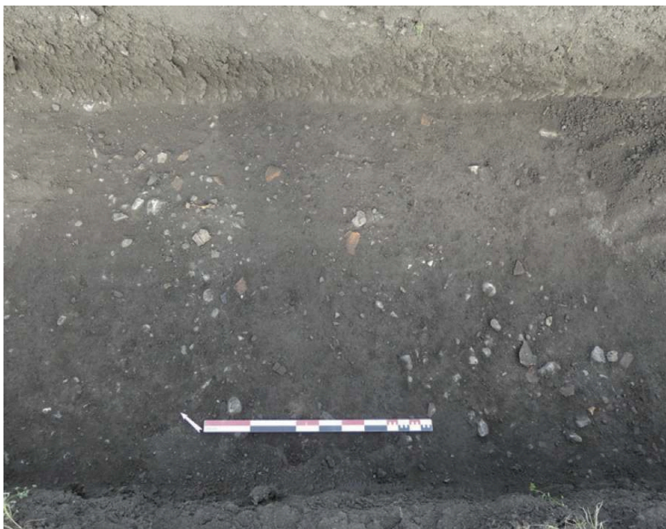
Fig. 2 – Vue générale du sondage manuel réalisé dans le niveau de sol et enregistré en tant que US 803