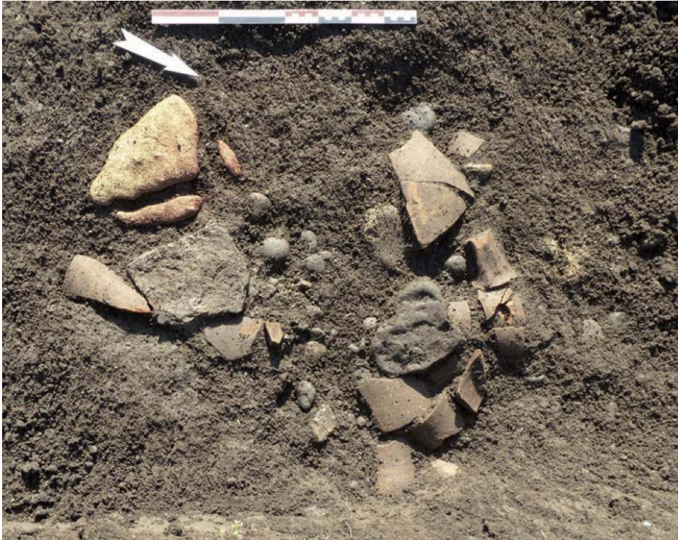
Fig. 3 – Vue de la structure 901 (tranchée 9)

Aménagement constitué de fragments d'amphores chauffés, de blocs de basalte et d'un bloc calcaire rougi sous l'action du feu.