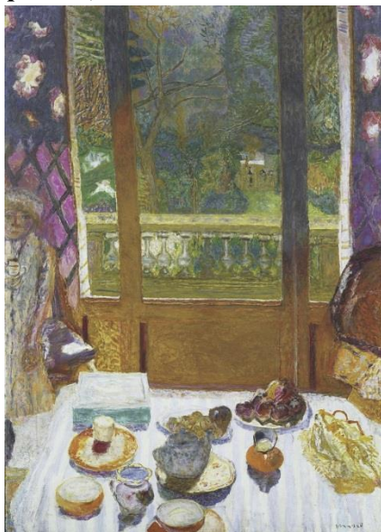
П'єр Боннар «Обідня кімната», 1930-1931 рр.