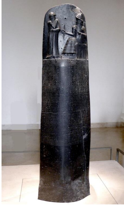
Кодекс Хаммурапі, 1792-1750 рр. до н.е.