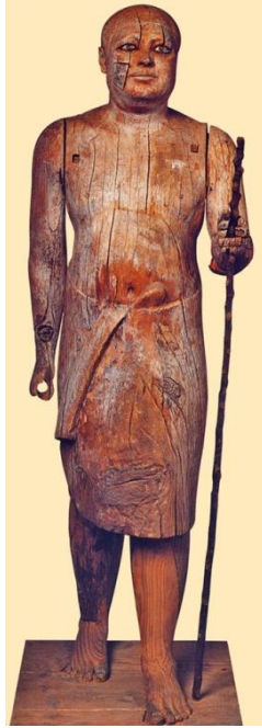
Статуя Ка-апера, с. III тис. до н.е.