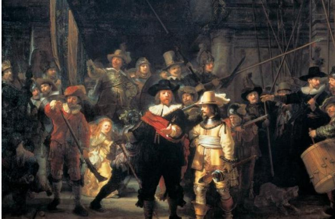
Рембрандт Гарменс ван Рейн «Нічна варта», 1642 р.