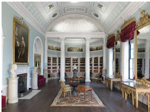
Robert Adam, Kenwood: Library (1767-1769)

також тому, що зала симетрична, геометрична і ретельно збалансована».