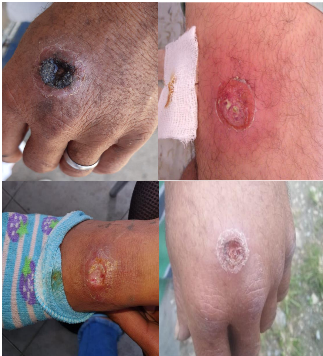
Figura 2. Lesiones de los casos de Leishmaniasis cutánea en el brote ocurrido en zona rural de Ibagué, 2017.

oral o anfotericina B liposomal. Los principales efectos adversos fueron dolores osteomusculares, malestar general y fiebre; ningún tratamiento fue suspendido. Se evidencia amplias distancias para acceder al tratamiento, puesto que los pacientes recorren entre 10,2 a 20,3km desde las veredas hasta la USI E.S.E., ubicada en el casco urbano; los resultados evidencian una subnotificación de casos. En Colombia, la transición al actual modelo de salud ha centralizado la asistencia en salud en los cascos urbanos, dificultando la asistencia sanitaria en la zona rural (Vargas et al. 2010).