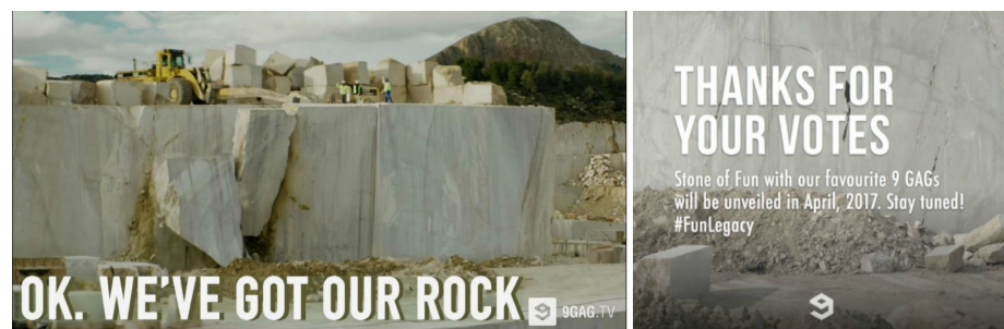
Abbildung 7: „Stone of Fun“ (2017)

Rund dreihundert Jahre später, im Februar 2017, veröffentlichte die Internetplattform 9gag ein Video, in dem erklärt wird, dass Skulpturen, Bilder und andere Artefakte zwar viel über die Geschichte unserer Spezies erzählen, aber leider durch und durch langweilig seien. 30 Um dies zu ändern und zukünftigen Generationen von Historiker_innen die wirkliche (und unterhaltsame) Natur heutiger Menschen nahezubringen, würden neue Skulpturen erschaffen werden. Hierfür sollten die Nutzer_innen der Plattform 9gag für ihren Lieblingsinhalt bzw. ihr Lieblingsmeme auf der Seite abstimmen und sich unter dem Hashtag #funlegacy über potenzielle Kandidaten austauschen. Der Sieger wurde anschließend als Steinskulptur aus italienischem Marmor gemeißelt und an einer geheimen Stelle im Boden vergraben. Als sogenannter „Stone of Fun“ soll er einen Gegenentwurf zu herkömmlicher Kunst darstellen und die „dümmste und lächerlichste Seite der Menschheit“ für zukünftige Generationen überliefern. 31