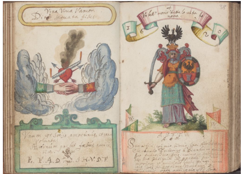
Abbildung 4: von Dienheim, Album amicorum (1629: 32)

ses handwerkliches bzw. zeichnerisches Talent verfügen oder zumindest Beziehungen zu Menschen unterhalten, die die visuelle Ausgestaltung des Emblems vornehmen konnten.