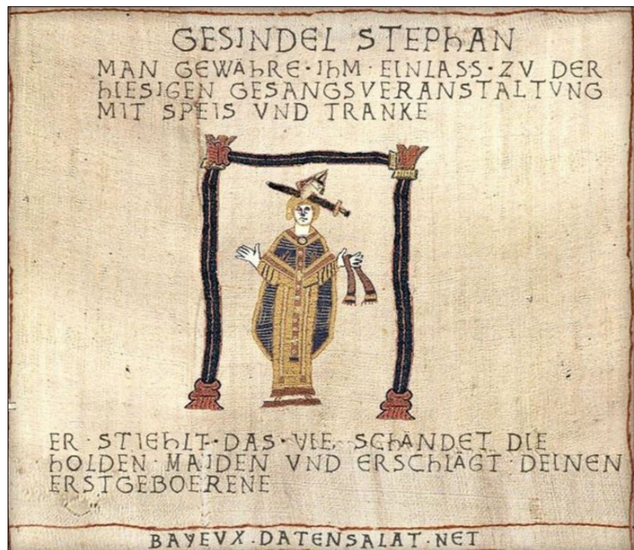
Abbildung 10: Gesindel Stephan-Meme

schiedliche methodische Zugriffe: So haben sich die Literaturwissenschaften verschiedener Sprachen, die Kunst- und Kulturwissenschaften, die Altphilologien, aber auch die Geschichtswissenschaft und die Theologie mit der Emblemkunst beschäftigt. Meist eher am Rande beteiligt waren Disziplinen wie das Münzwesen oder die Architektur, dafür aber mit fruchtbaren neuen Fragen im Hinblick auf die Verbreitung von Emblemen, auf deren Entstehungsbedingungen und ihren Einfluss auf die Lebenswelt der Produzent_innen und Nutzer_innen. 43 Ähnlich verhält es sich mit der Forschung zu Memes. Waren es zunächst eher biologische Fragen nach Ähnlichkeiten von Memes mit Genen, beschäftigten sich in der Nachfolge von Richard Dawkins auch andere Disziplinen mit dem Phänomen, beispielsweise die Psychologie oder die Kognitionswissenschaften. Beide Gattungen – Embleme wie Memes – müssen im Kontext ihrer jeweiligen Zeit und der technischen Möglichkeiten als virale Phänomene verstanden werden, d. h. sie verbreiteten sich als analoge wie digitale Artefakte weit über den engen Kreis der sie jeweils Schaffenden hinaus aus. Die Ähnlichkeiten in Machart, Verbreitung und Wirkung von Emblemen und Memes lohnen weitere Untersuchungen. Hierfür scheint es zielführend, Fragen, Ansätze und Methoden aus der frühneuzeitlichen Emblemforschung mit denen der Memeforschung zu kombinieren. Sowohl kultur- und literaturwissenschaftliche Fragen an die Objekte selbst