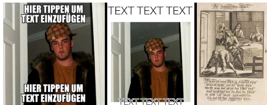
Abbildung 8: "Classic" Meme-Vorlage, "Modern" Meme-Vorlage und Emblem