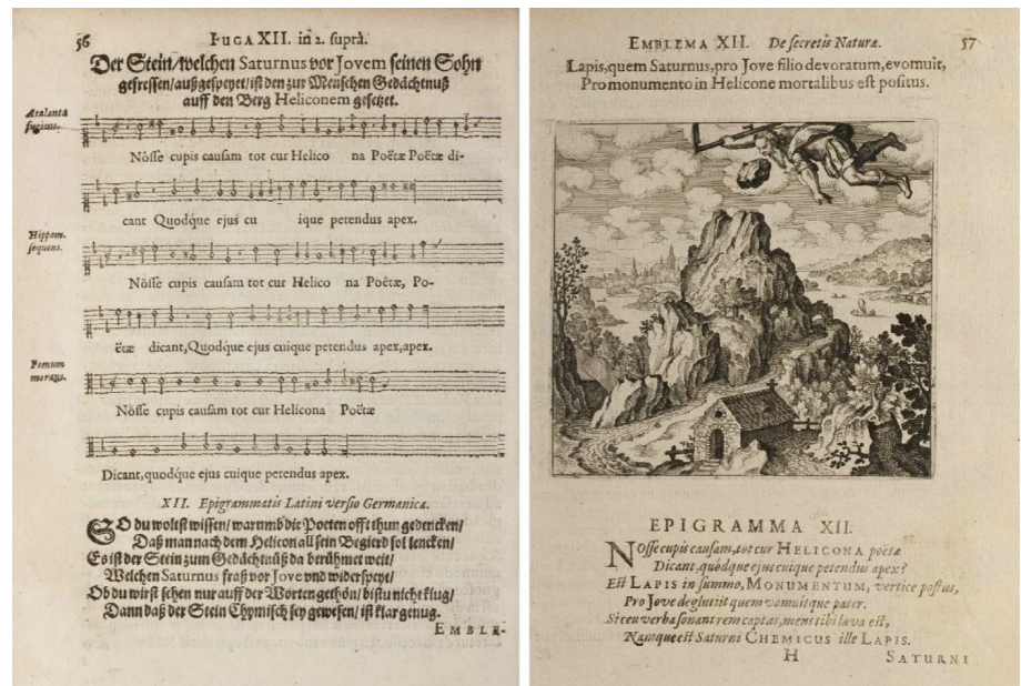
Abbildung 6: Maier, De secretis Naturæ, 1618

kurse“ versammelt hatte, die zusätzlich zu einer Abbildung noch mit einem Motto, einem Epigramm, einem umfangreicheren Prosatext und einer Fuge für drei Singstimmen versehen war. Text, Bild und Musik waren hier an einem Ort vereint und Maiers Kompendium gilt deswegen als eines der ersten multimedialen Kunstwerke (Vgl. Abb. 6). 29