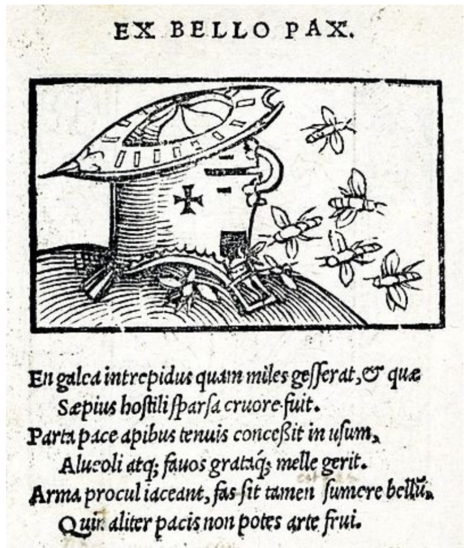
Abbildung 1: Alciato, Emblematum liber , Emblem Nr. 45

Bauwerken, die durch Ornamente an ästhetischem Wert gewinnen, erhöhten Embleme die Wirkung eines (Kunst-)Objekts beim Betrachter. Die mit „eingeluemeten Kunststuecklin“ verzierten Zeugnisse der Handwerkskunst würden von ihren Besitzern weitaus mehr geschätzt als unverzierte, so Holzwarts Urteil. Der Nutzwert, der sich durch die Verwendung von Emblemen ergebe, würde v. a. durch deren verrätselten und damit „geheymnussreichen“ Charakter noch gesteigert.