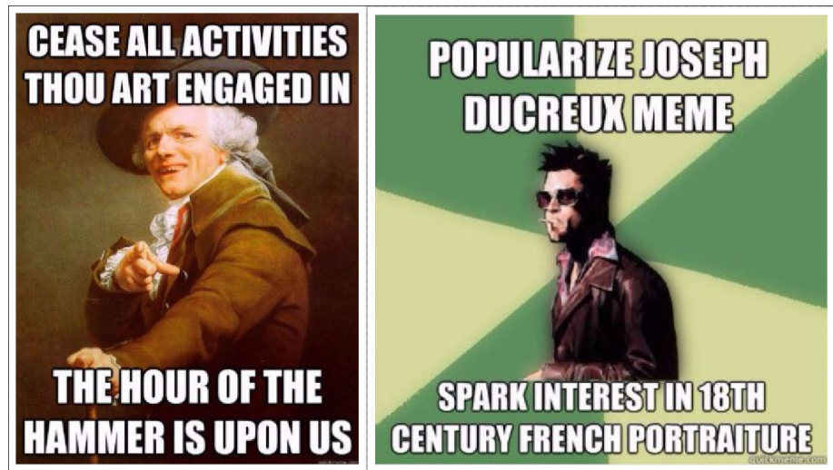
Abbildung 9: Joseph-Ducreux- und Helpful-Tyler-Durden-Memes

Durden"-Meme kommentiert dieses Phänomen – natürlich – in Form eines Memes (vgl. Abb. 9) 39, 40 .