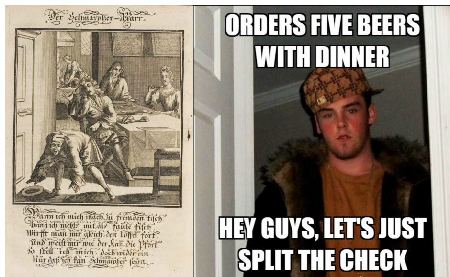
Abbildung 5: Der Schmarotzer=Narr (1705); Scumbag Steve (2011)

Im direkten Vergleich dieses Emblems mit früheren Beispielen, etwa von Alciato, fallen am Schmarotzer=Narr besonders zwei Aspekte auf: Zum einen erscheint der Rätselcharakter des Emblems deutlich reduziert, denn zwischen Motto, pictura und subscriptio bleibt wenig zu entschlüsseln – der Sinn erschloss sich zeitgenössischen Betrachter_innen also vergleichsweise einfach, so darf man zumindest vermuten; zum anderen wird besonders an der pictura deutlich, wie sehr die Abbildung zu Beginn des 18. Jahrhunderts bereits an Be-