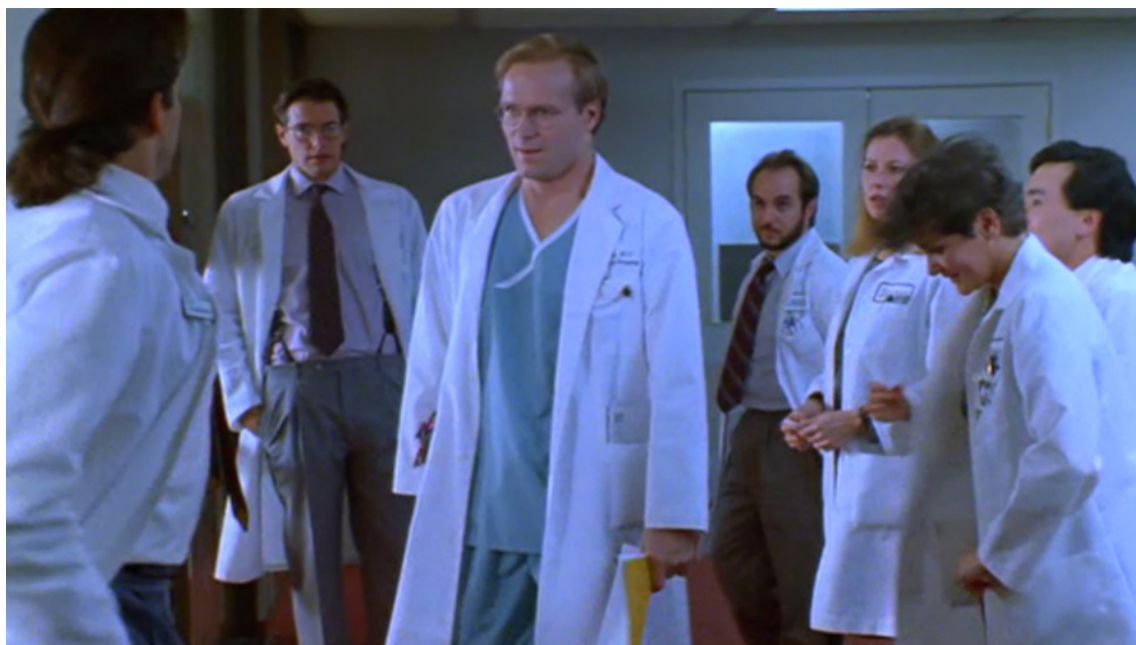
Foto 9. La conversación con los residentes para que adopten la condición de pacientes