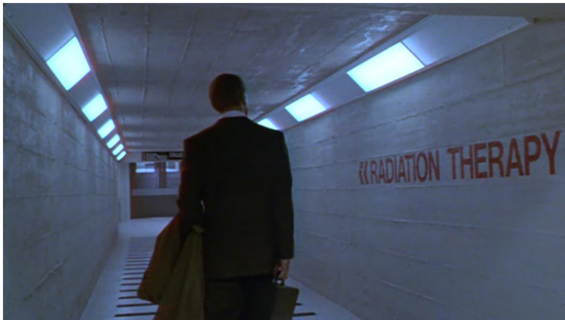
Foto 3. El primer contacto con el servicio de Radioterapia