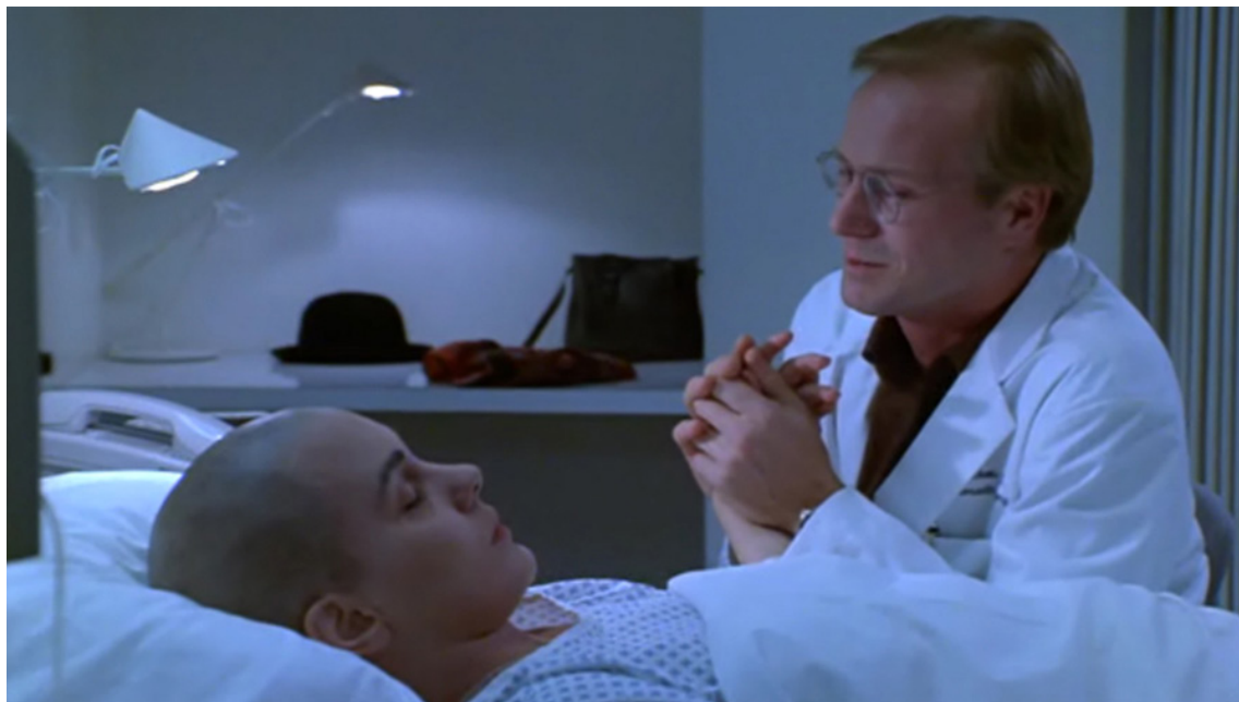
Foto 5. Su despedida de June

confiado en sus dotes de cirujano (Foto 6), o dejar que aparezca su yo moral ante ese otro paciente en la cochera del hospital. Tampoco testificará a modo de componenda en un juicio de mala praxis poniendo fin a suerte de « quid pro quo », ataviado de amistad, que mantenía con Murray.