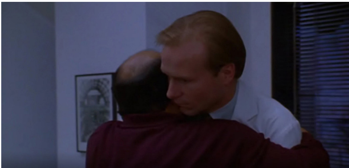
Foto 6. El abrazo de aquel paciente a ser trasplantado