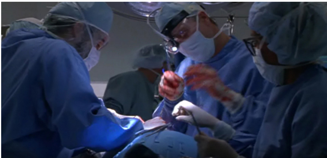
Foto 1. En el quirófano durante una cirugía de alta complejidad