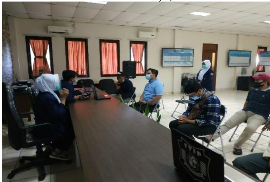
Gambar 3. Sesi Tanya Jawab

Pengabdian masyarakat berupa penyuluhan bahaya merokok yang dilakukan di RW 07 Keluahan Poris Jaya diberikan dengan cara ceramah, pemutaran video, dan pembagian leaflet . Menurut Nurmiyanto & Rahmani (2013), sosialisasi bahaya rokok juga dapat dilakukan dengan cara menonton film dokumenter, sosialisasi door to door menggunakan poster, dan penempelan poster di tempat-tempat yang strategis. Selain materi tentang bahaya merokok, penyuluhan pada pengabdian masyarakat ini juga memberikan informasi tentang tips mengelola keinginan merokok dengan metode 4Ds. Massachusetts Department of Public Health , (2021) menjelaskan cara untuk berhenti dari kebiasaan merokok dengan metode 4Ds yaitu delay (tunda), distract (alihkan), deep breathe (nafas dalam), dan drink water (minum air). Upaya berhenti merokok dapat dilakukan dengan cara membentuk peer group sekaligus pionir yang mampu menggerakkan dan memiliki daya tular yang positif (Fitarina, Suarni, Metri, Aliyanto, & Pranajaya, 2020).