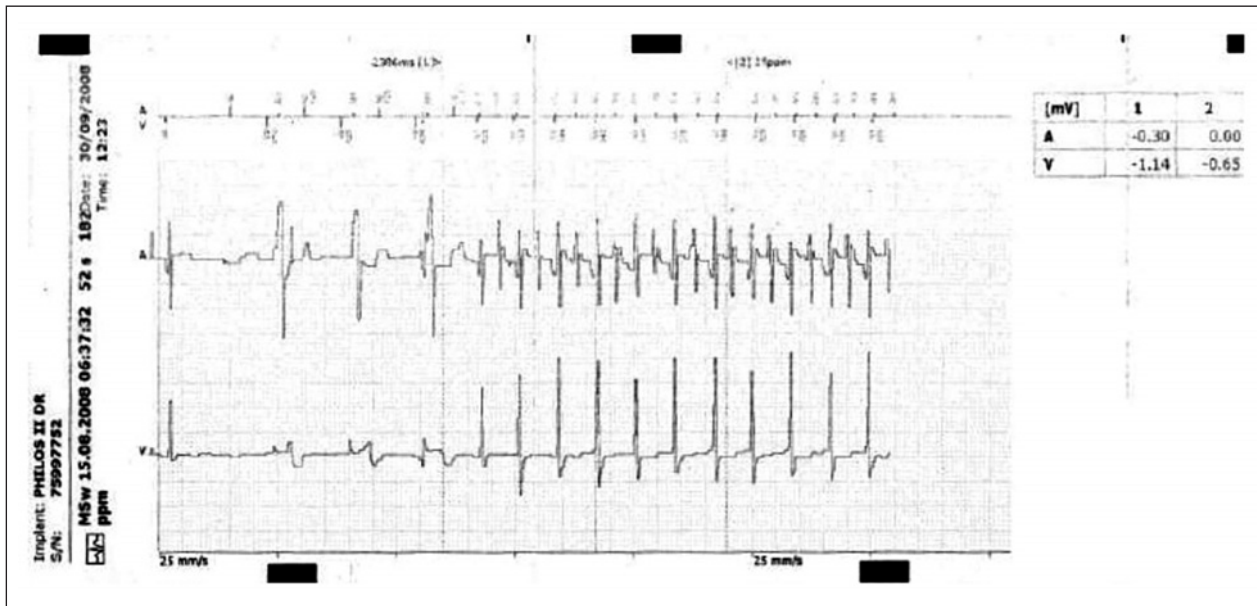
Figura 1 - Detecção do início de TA pelo gerador Philos II DR. Observa-se frequência acima de 300 bpm no canal de marcas e no eletrograma do canal atrial.

Na comparação entre as indicações do implante dos marcapassos (DNS vs. BAVT) não foi observada diferença significativa entre os dois grupos ( P=0,07 ). Dos 29 pacientes que receberam o marcapasso por