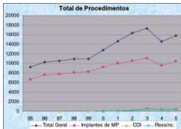
Figura 1 - Procedimentos realizados em 11 anos do RBM.

A mesma tendência de aumento é observada em relação aos implantes de desfibriladores e ressincronizadores até maio de 2003, quando foram realizados 885 implantes. Em 2004, houve queda para 815 implantes. Neste 11º ano, entretanto, foram efetuados