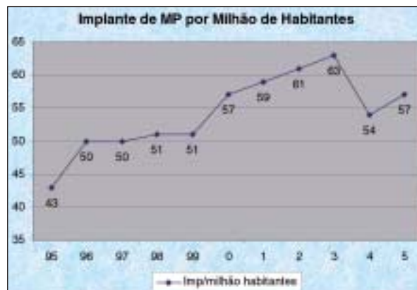
Figura 2 - Implantes de MP por milhão de habitantes.