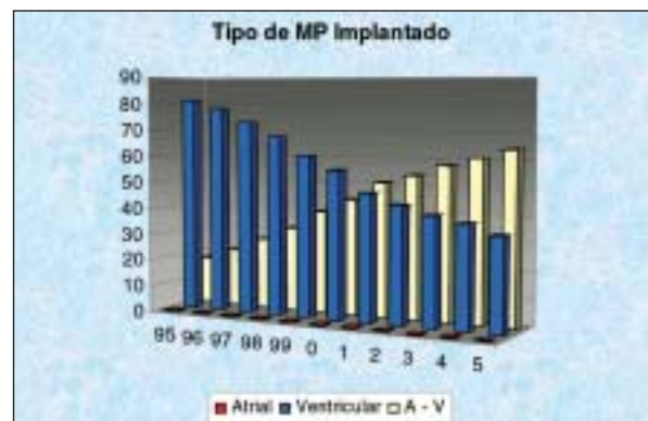
Figura 5 - Tipo de marcapasso implantado.