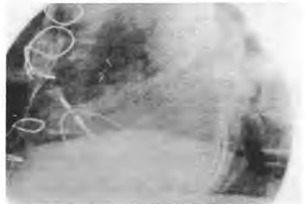
Figura 2 - Vista lateral izquierda

Estas anomalías del sistema cava superior pueden ser detectadas mediante angiografía 19 , ecocardiografía combinada con contraste 20 , angiografía por sustracción digital, o resonancia magnética 21 , aunque no son procedimientos usados corrientemente en nuestra rutina previo al implante.