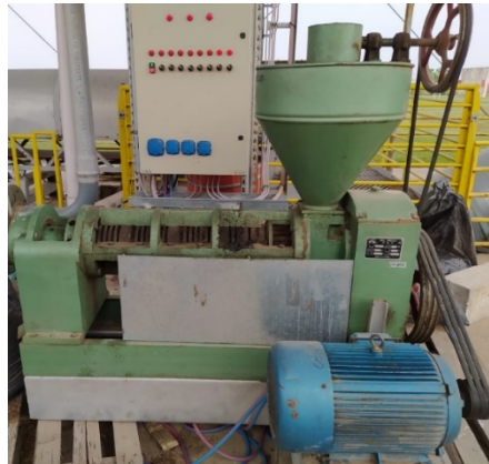
FIGURA 2 Prensa extrusora para soja

†† Materia orgánica=volátiles + carbono fijo