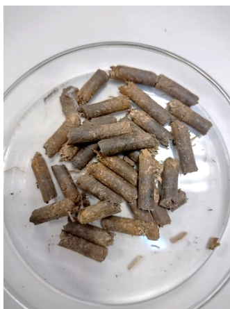
FIGURA 5 Pélets Híbridos de rastrojos de soja/maíz/sorgo.