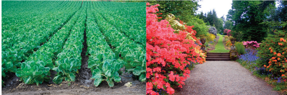
Figura 2. ¿Plantación o jardín?

de hacerlo de dificultades de aprendizaje. La diferencia de matiz radica en que todos podemos aprender, de manera que el foco ha de ponerse en promover situaciones de aprendizaje para que todos podamos avanzar. Para ilustrar esto propuso la metáfora del jardín (figura 2), donde se contraponen la imagen de una plantación de lechugas, todas iguales, frente a un jardín donde convive una amplia variedad de plantas en proceso de floración.