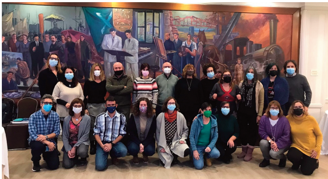
Figura 1. Asistentes al seminario federal en la sede del CIEM de Castro Urdiales

Iniciamos con este artículo la crónica, en tres partes, del seminario Matemáticas inclusivas , organizado por la Federación Española de Sociedades de Profesores de Matemáticas (FESPM), con la colaboración del Centro Internacional de Encuentros Matemáticos (CIEM) y del Ministerio de Educación y Formación Profesional y que tuvo lugar los días 26, 27 y 28 de noviembre de 2021. Aderezamos la crónica-resumen con algunas reflexiones sobre este tema, que resulta de una gran trascendencia en nuestra labor como docentes.