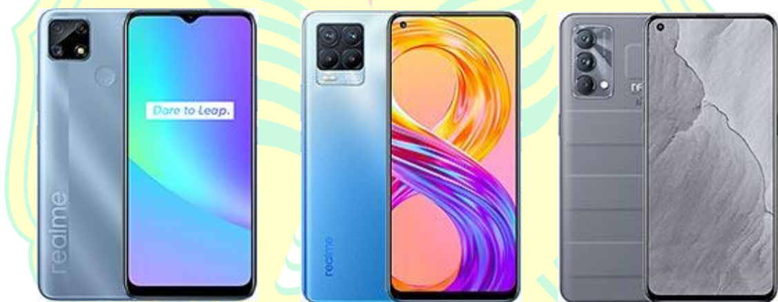
Gambar 1. 2 Lini Produk Smartphone Realme

Target pasar utama dari Realme adalah para kaum muda yang sedang semangat untuk berekspresi, mengedepankan gaya, dan antusias terhadap teknologi-teknologi terbaru (Permana, 2020). Realme adalah salah satu brand yang menghasilkan produk-produk dengan spesifikasi terbaik dengan harga yang terjangkau. Salah satu aspek yang ditonjolkan dalam setiap produk Realme adalah Chipset dan kualitas kamera. Dengan harga yang terjangkau, Realme memberikan konsumen berbagai produk dengan spesifikasi yang berada di atas harga jualnya. Menurut Carisinyal.com, produk-produk Realme memiliki seri-seri khusus yang menggambarkan kelas pasar mereka. Hal tersebut bisa dilihat berdasarkan perbedaan harga dan fitur-fitur yang diberikan.