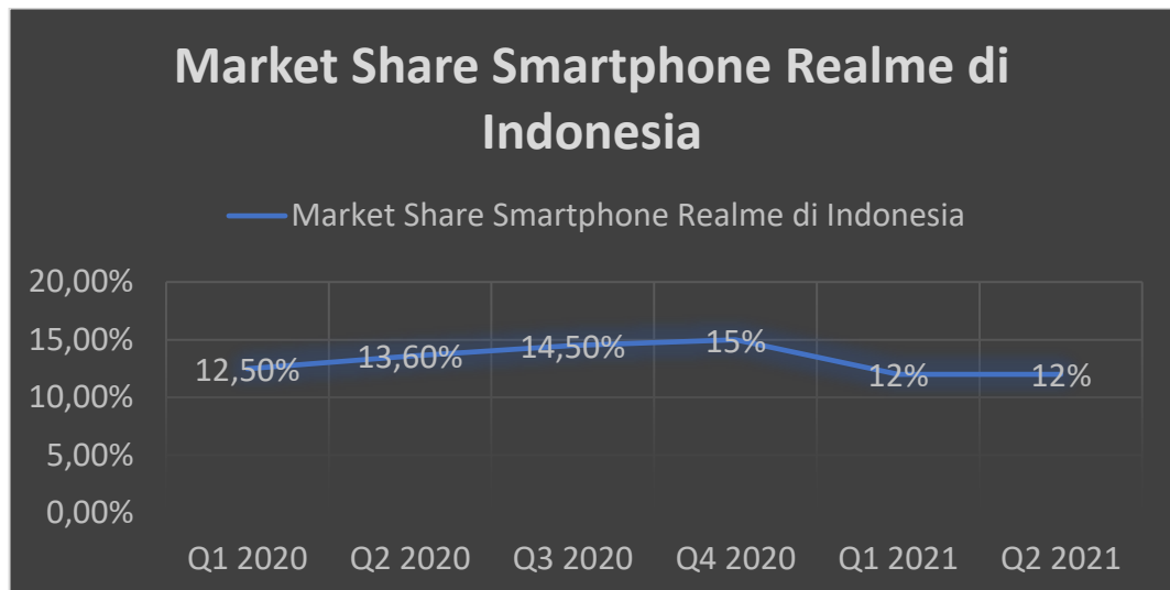
Gambar 1. 3 Fluktuasi Perolehan Market Share Realme