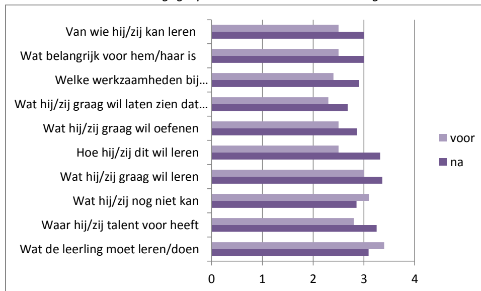
Tabel 9. Inhoud van de stagegesprekken voor en na de training

Tabel 9 laat de veranderingen zien die zijn opgetreden in de stagegesprekken voor en na de training. Na de training wordt meer gesproken over wat studenten graag willen leren, van wie zij dit kunnen leren en hoe zij dit willen leren. Er wordt ook meer gesproken over wat belangrijk is voor de studenten, welke werkzaamheden bij hen passen, wat zij graag aan kwaliteiten willen laten zien, waar zij talent voor hebben en wat zij nog graag willen oefenen. Er wordt na de training minder gesproken over wat zij nog niet kunnen en wat ze – als gevolg daarvan – nog moeten leren. De gesprekken zijn, kortom, duidelijk meer loopbaangericht geworden.