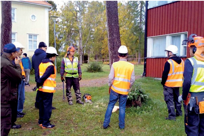
Kuva 5. Ruukin metsäpäivän suunnittelu ja toteutus keräsi pohjoisen yrittäjäyhteön.

Metsäkeskus vastaa useista valtakunnallisista ja alueellisista yritystoimintaan suunnatuista kehittämishankkeista. Moni hankkeista on suunnattu bioenergia-, puutuote- ja metsäpalveluyrittäjyyden sekä puurakentamisen kehittämiseen ja yritysten toimintaedellytysten parantamiseen. Hanketoiminnan suunnittelua ohjaavat yritysten tarpeet. Hankkeissa Metsäkeskus tekee laajasti yhteistyötä kotimaisten ja kansainvälisten toimijoiden kanssa. Metsäpalveluyritysten verkostoitumista Metsäkeskus on edistänyt Pohjois-Pohjanmaalla esim. Metsäpalveluyrittäjyys kasvuun-hankkeen toimenpiteillä vuosina 2016–2017.