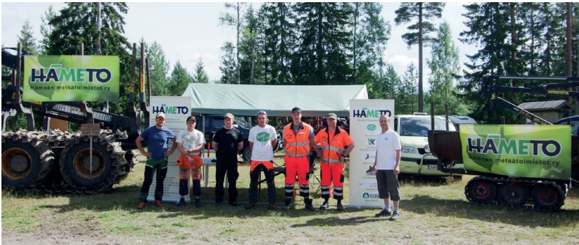
Kuva 3. Hämeen Metsätoimisto Messilän metsätapahtumassa.