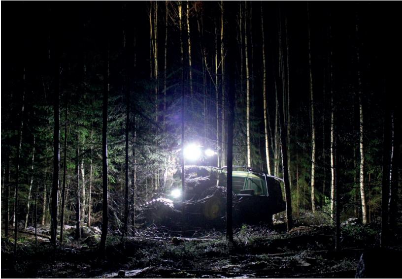
Kuva 2: Yksin yössä. Metsäalan työ on usein hyvin yksinäistä puurtamista. Toimiva verkosto auttaa jaksamaan.