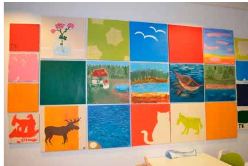
KUVA 4. Ystävän maalaus -yhteisötaideteos.

Ystävänmaalaus koostuu 23 yksittäisestä öljyvärimaalauksesta, joissa ystäväkirja-kartoitusmateriaalin teemat varioivat (kuva 4). Kartoitusmateriaali toimi lähtökohdana asukkaiden toiveiden selvittämisessä ja sen avulla tavoitettiin asukkaiden toive keväisestä värimaailmasta. Kartoitusmateriaalia ja maalausinstallaatiota rinnastava analyysi osoittaa, kuinka yhteisötaideprosessin lopputuloksena syntyneessä maalausinstallaatiossa painottuu suomalaista luontoa peilaava vihreä-sinisävyinen värimaailma, jota raikastavat punaiset ja keltaiset sävyt. Kokonaisuuteen tuo hengittävyttä maalauspohjien canvas-kankaiden osittainen esille jättäminen. Ystävän maalaus -installaation teemoja analysoitaessa voidaan todeta maalausinstallaatiosta löytyvän erilaisia näkökulma- ja ilmaisuvaihtoehtoja. Kuvallisen vuoropuhelun kehittymiskohtia tarkasteltaessa nousee esille kolme keskeistä ja kehittyvää teemaa: järvimaisema-teeman laajentuminen maalausinstallaation pääteemaksi, eläinteeman varioituminen ja luontoon liittyvät harrastukset.