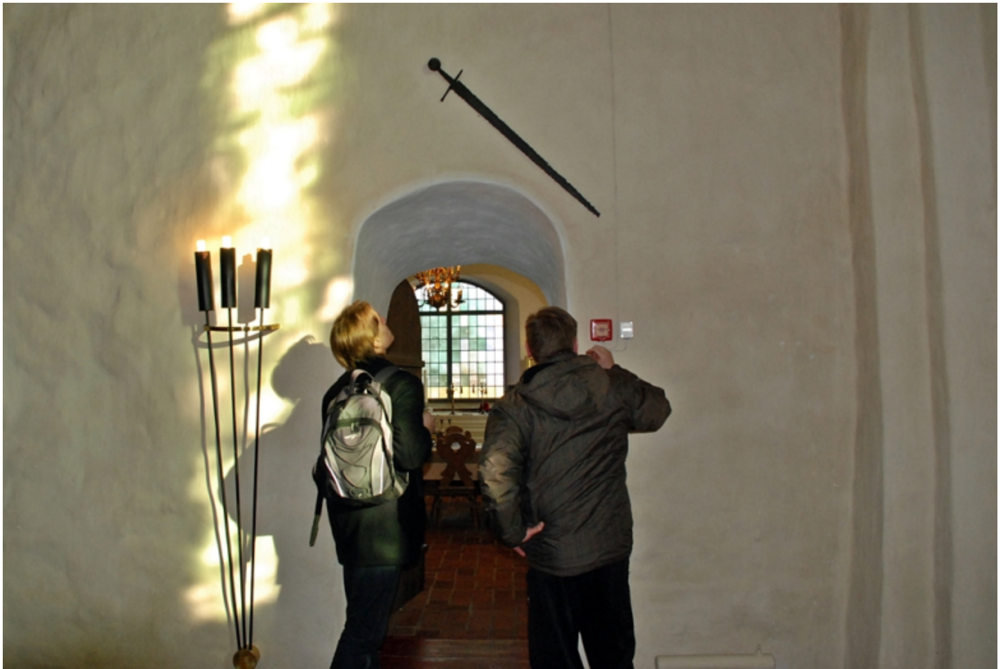
Ristiretkiaikainen miekka Huittisten kirkossa.

Lisätietoa kirkosta Huittisten seurakunnan verkkosivulla