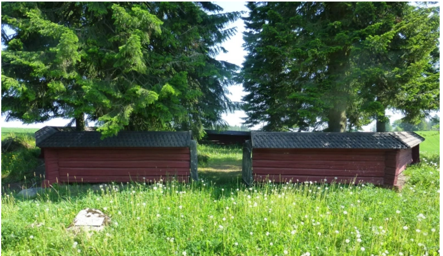
Tamaren kirkonpaikka Vampulassa sijaitsee idyllisessä paikassa Kiltajärven rannalla.

Koska kaikki esitellyt kohteet eivät ole varsinaisia turistikohteita, niiltä ei löydy parkkipaikkoja eikä opastauluja. Vierailijan kannattaakin varata jalkaansa hyvät kengät ja lukea kohteista lisätietoa esimerkiksi Kulttuuriperinnön palveluikkunan kautta. Artikkelissa mainitut osoitteet ovat suuntaa antavia, ja niitä voi käyttää esimerkiksi auton navigaattoria varten, mutta varsinaiset parkkipaikat kannattaa valita omaa harkintaa käyttäen ja muu liikenne huomioiden.