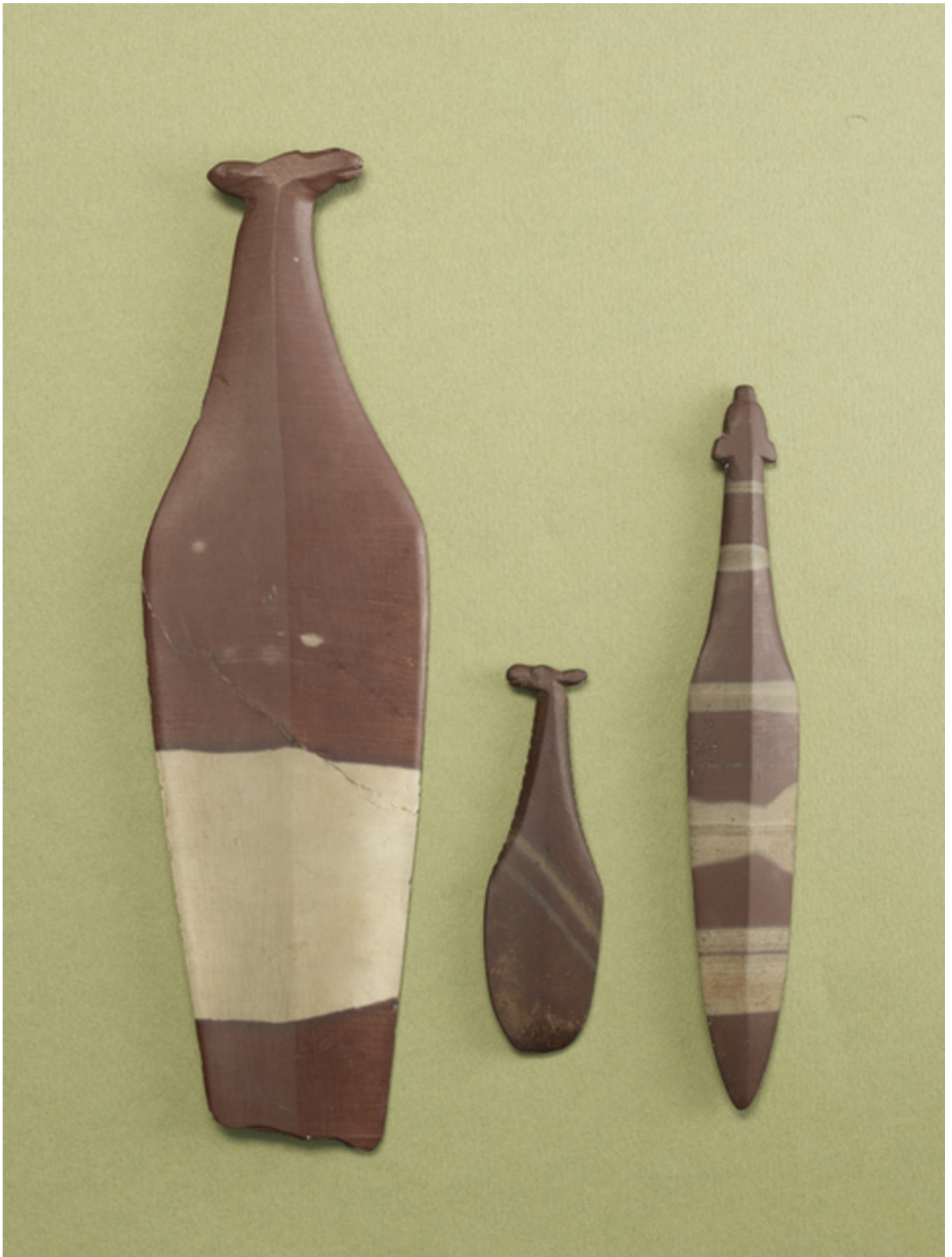
Niin kutsutusta Kölin punaliuskeesta valmistettu hirvenpääkahvainen tikari (vas.) löydettiin Törmävaaran asuinpaikka-alueelta halkovasta sorakuopasta vuonna 1946.