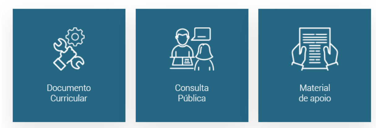
Figura 5 – Captura de tela da página eletrônica oficial da BNCC