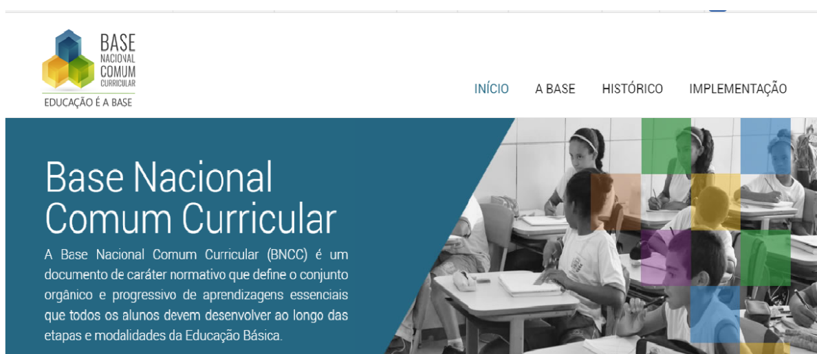
Figura 1 – Captura da parte superior da página eletrônica oficial da BNCC