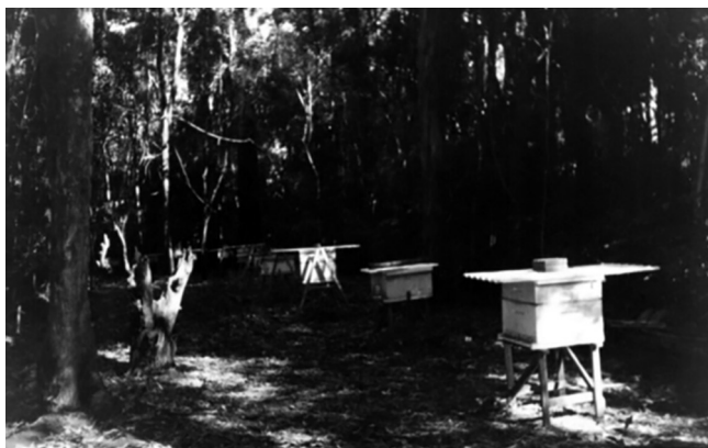
Figura 1 – Caixas de colônias de abelhas africanizadas ( Apis mellifera L.) na Fazenda Experimental Lageado, Unesp, campus de Botucatu