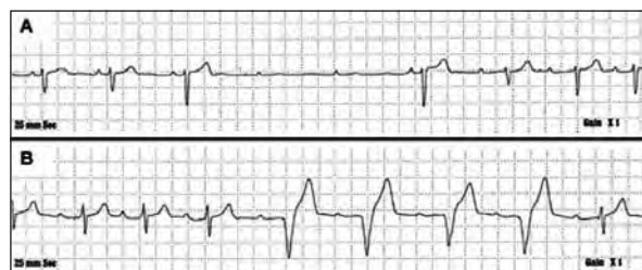
Figura 2 - Traçado de Holter do paciente 5, (A) com evidência de bloqueio AV paroxístico e (B) após o implante de marcapasso de dupla-câmara dotado de sensor e estímulo ventricular apropriados durante um bloqueio AV paroxístico.

Pacientes que passam anos sem apresentar síncope por bloqueio AV paroxístico podem experimentar episódios múltiplos dentro de um curto período de tempo. Isto pôde ser verificado em três dos pacientes deste