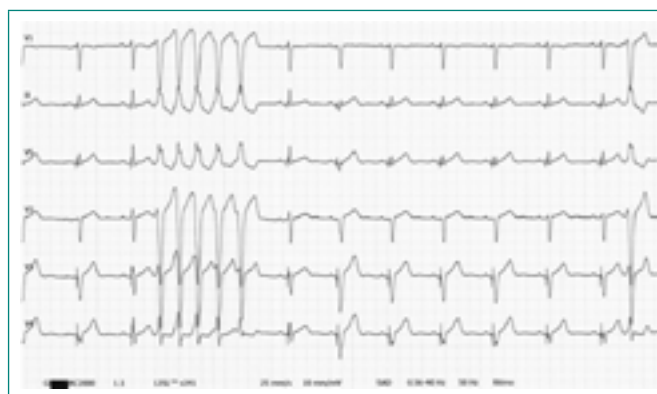
Figura 4. ECG tras tratamiento antiarrítmico e implante de DAI. Se objetiva racha autolimitada de 5 latidos de TVM no sostenida. Nótese que la morfología de los complejos QRS que abarca la taquicardia es la misma que la del ECG al ingreso

El paciente ingresa por arritmias ventriculares no sostenidas bien toleradas hemodinámicamente, por lo que inicialmente se decide un manejo conservador con tratamiento betabloqueante, con el que las taquicardias se hacen más autolimitadas y esporádicas durante su estancia hospitalaria. Sin embargo, ante los hallazgos en la resonancia compatibles con MNCVI se decide implantar un desfibrilador automático (DAI) como prevención primaria de muerte súbita. A pesar del tratamiento antiarrítmico, el paciente continúa con TVM no sostenidas (Figura 4), por lo que inicialmente se programa una ablación endocárdica ambulatoria. Fue dado de alta con el diagnóstico de MNCVI bajo tratamiento con sotalol (160 mg/12 h) y seguimiento por televigilancia. Tras 4 meses de seguimiento, no ha vuelto a presentar arritmias, por lo que se decide continuar con el tratamiento médico y visitas periódicas en consulta de arritmias para valorar, en función de la evolución clínica y eléctrica, si es necesario ablacionar la arritmia.