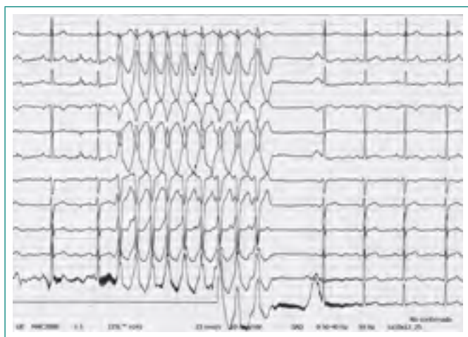
Figura 2. ECG durante el ingreso. Se objetiva una racha de TVM no sostenida, con morfología de bloque de rama izquierda y origen en el tracto de salida del ventrículo derecho