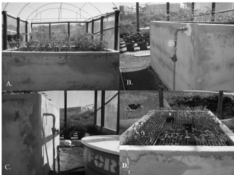
FIGURA 2: Detalhes dos tanques de subirrigação. FIGURE 2: Overviews of sub-irrigation tanks.

Em cada bandeja foram utilizadas dezoito plantas cultivadas em tubetes grandes e trinta e seis plantas em tubetes pequenos, utilizando-se as mesmas espécies avaliadas na irrigação por microaspersão.