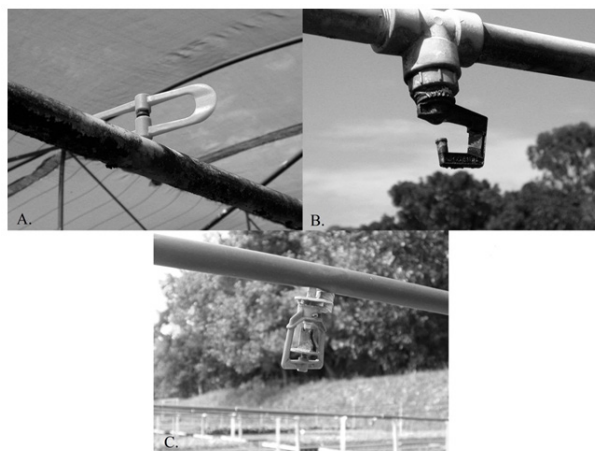
FIGURA 1: Microaspersores MA-20 (A), Inverted Rotor Spray (B) e Rondo (C), instalados no viveiro de mudas florestais em Itutinga - MG.

O enchimento dos tubetes com substrato foi feito de maneira manual. O substrato utilizado foi o Tropstrato Florestal ® fabricado pela empresa Vida Verde, composto por fibra de coco, vermiculita,