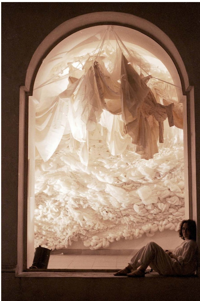
Figura 3. Nora Correas, Penélope (1986).

Paradójicamente, si bien estas muestras concentran buena parte de las disputas de sentido revalorizadas en nuestra actualidad, poco sabemos de ellas. Resulta difícil encontrar imágenes, documentos o hasta textos que hayan trabajado estas exhibiciones, aún hoy con las facilidades digitales que disponemos.