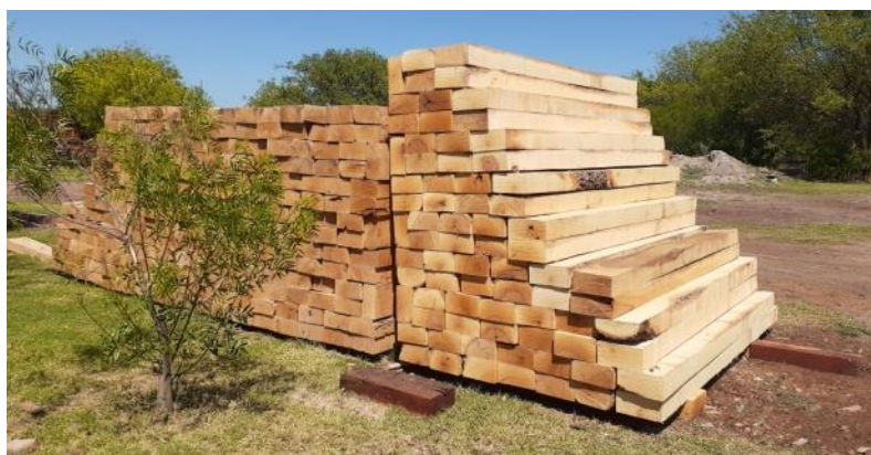
Figura 1.12. Durmientes de Aspidosperma quebracho blanco (Monte Quemado, Santiago del Estero).

En cuanto a la ITM de tableros, no hay existencia en la provincia.