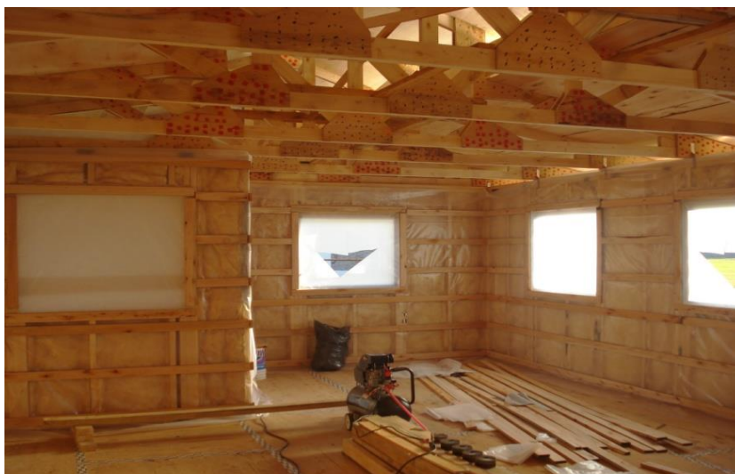
Figura 1.16. Estructura de vivienda realizada con madera de Salix spp. -LIMAD.

El resto de la provincia presenta una producción más homogénea pero en general representada por productos de primera transformación, principalmente tablas, y tirantes en menor proporción. Asimismo, existe una representación de productos de remanufactura de bajo valor agregado, constituidos principalmente por pallets y cajones para productos fruti-hortícolas.