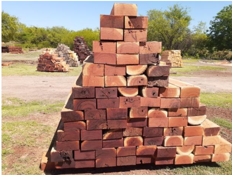
Figura 1.11. Durmientes de Schinopsis quebracho colorado (Monte Quemado, Santiago del Estero).

En cuanto a los productos de aserrado, se distinguen dos grupos. Uno de ellos, con mayor representación, se corresponde a productos de remanufactura de bajo valor agregado, dominado por la producción de durmientes (Figuras 1.11 y 1.12), y en menor medida, por producción de varillas, tablas, tirantes, tirantillos, tablones, alfajías y vigas. Mientras que el otro grupo, representado en menor proporción, se corresponde a productos de remanufactura de alto valor agregado, entre los que se destacan, muebles, aberturas, carpintería rural y pisos.