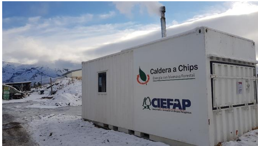
Figura 1.21. Caldera a base de chips (Bariloche, Rio Negro).

Actualmente, el país cuenta con alrededor de diez fábricas de pellets aunque aún no están trabajando a máxima capacidad. Para el desarrollo del mercado interno se estima que se requiere financiamiento adecuado para el cambio de tecnología (de gas licuado de petróleo-GLP o fuel oil a chips o pellets ) y principalmente, mayor información hacia los usuarios sobre las ventajas del uso de biomasa como combustible.