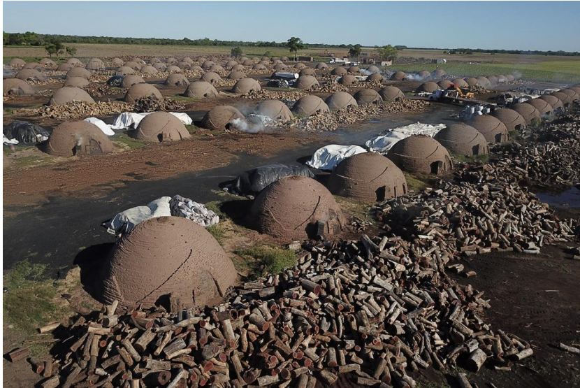
Figura 1.18. Elaboración de carbón vegetal con destino de exportación (Chaco).

Algunas provincias argentinas carecen de una red de gas natural, y por ende, deben recurrir a otras fuentes para garantizar la provisión energética. A modo de ejemplo, en una provincia netamente forestal como Misiones, se vienen llevando a cabo proyectos que emplean materiales como chips, viruta y aserrín, y sus derivados densificados (como pellets ), para la generación eléctrica y térmica (Figura 1.19). El mercado de pellets es uno de los que mayor crecimiento registra en el mercado internacional como sustitución de combustibles fósiles. En el año 2017, el mercado de pellets estaba valuado en 7,67 mil millones de dólares, pronosticando un crecimiento anual del 9,2% hasta el año 2025, que provendrá especialmente de los mercados asiáticos (Corea, Japón) y Canadá (MAGyP, 2019). En este contexto, nuestro país debiera aprovechar la abundancia de materia prima y las ventajas competitivas que presenta para aumentar su producción de biocombustibles densificados, no solo para el uso local sino también con destino a exportación.