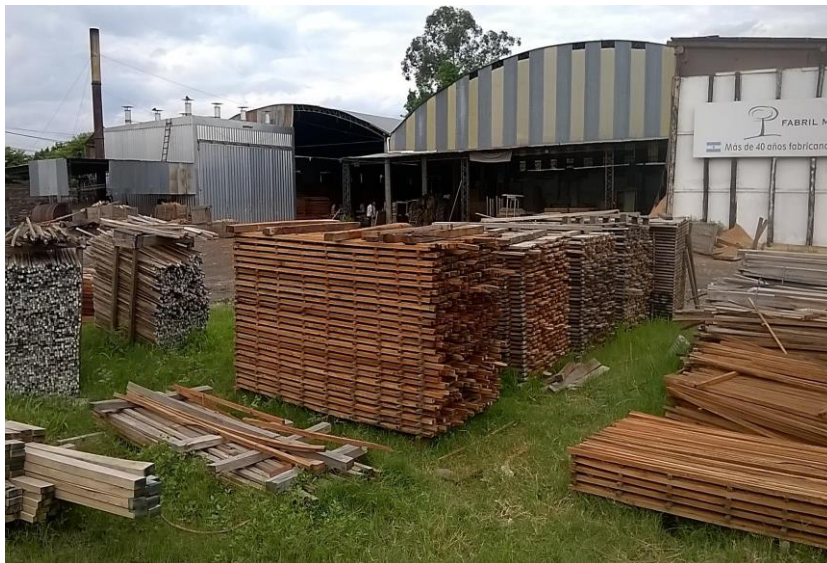
Figura 1.14. Productos de aserrado de especies nativas (Orán, Salta).

La producción es predominantemente de primera transformación, con productos tales como tablas, vigas y tablones verdes. Asimismo existen productos de remanufactura, en general, de bajo valor agregado, como tablas dimensionadas y embalajes y, en menor proporción, productos de remanufactura de valor agregado medio, como tablas para carpintería a medida, vigas, zócalos y machimbre (MA, 2017).