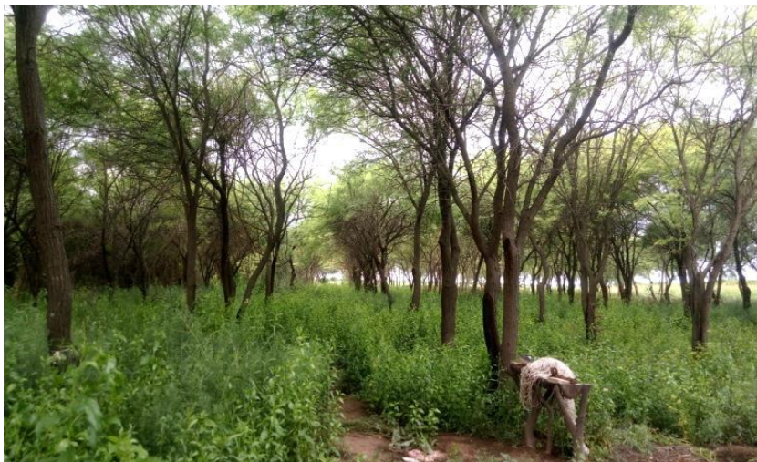
Figura 1.10. Plantaciones de Prosopis alba bajo riego (Campo Gallo, Santiago del Estero).

La provincia cuenta con un total de 5.580 ha forestadas (MA, 2017). Dentro de ella, se destaca en superficie, como especie principal, el algarrobo blanco ( Prosopis alba , Figura 1.10), seguido de álamo ( Populus spp. ), pino ( Pinus spp. ) y eucalipto ( Eucalyptus spp. ), en menor proporción.