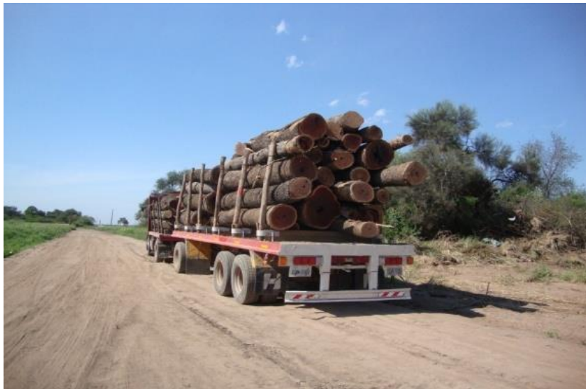
Figura 1.13. Trozas de Schinopsis balansae (Tres Isletas, Chaco).

En términos generales, el consumo de madera proviene mayoritariamente de los bosques nativos (Figura 1.13). Entre las especies predominantes se encuentran: algarrobo blanco ( Prosopis alba ), quebracho colorado chaqueño ( Schinopsis balansae ), guayaibí ( Patagonula americana ), palo blanco ( Calycophyllum multiflorum ) y urunday ( Astronium balansae ); en menor medida se utilizan otras especies nativas como vinal ( Prosopis ruscifolia ), guayacán ( Caesalpinia paraguariensis ), guaramina ( Sideroxylon obtusifolium ), ibirá pita ( Peltophorum dubium ), itín ( Prosopis kuntzei ), lapacho ( Tabebuia ipe ), pacará ( Enterolobium contortisiliquum ) y mora blanca ( Alchornea iricurana ).