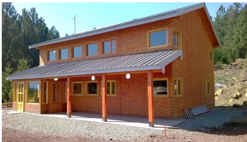
Figura 1.7. Construcción con BME (Abra Ancha, Neuquén).