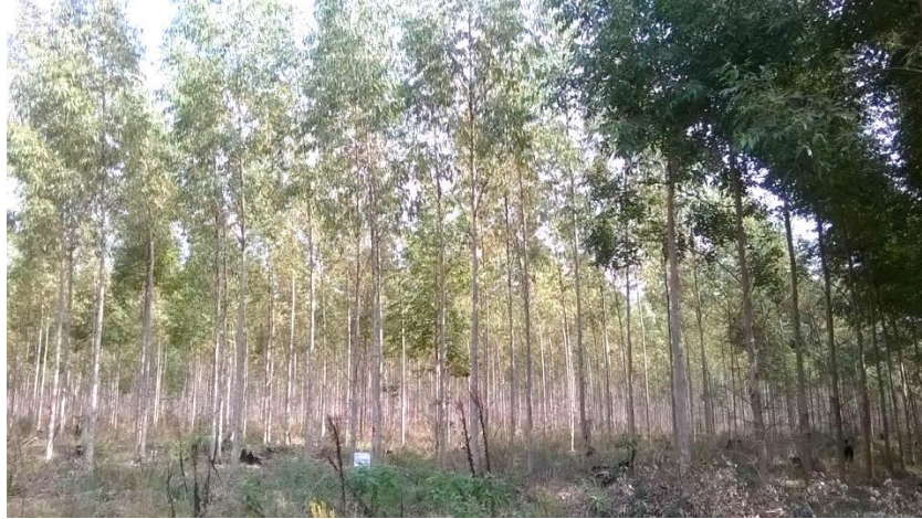
Figura 1.4. Plantación de Eucalyptus grandis (Ubajay, Entre Ríos).

Respecto a la ITM de aserrado, dicha provincia cuenta con una representación intermedia de aserraderos respecto a las otras dos provincias mesopotámicas. En cuanto a categoría, al igual que en la provincia de Corrientes, predominan los aserraderos de categoría “pequeño”, seguidos por los de categoría “mediano”, luego por los de categoría “micro”, finalizando en menor proporción por los de categoría “grande” (MA, 2017).