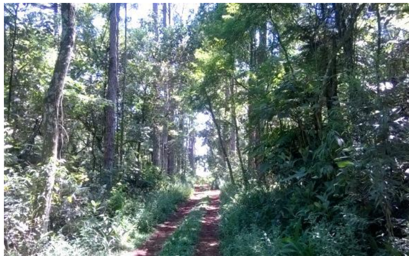
Figura 1.3. Selva misionera (Reserva Guaraní, Misiones).

La mayor proporción de la materia prima para las ITM proviene de bosques cultivados (locales o bien, proveniente de la provincia de Corrientes), con preponderancia en primer lugar de especies de pinos, seguidos en menor proporción y en orden de importancia, por eucaliptos, araucaria y otras cultivadas (kiri, paraíso y toona) (MA, 2018).