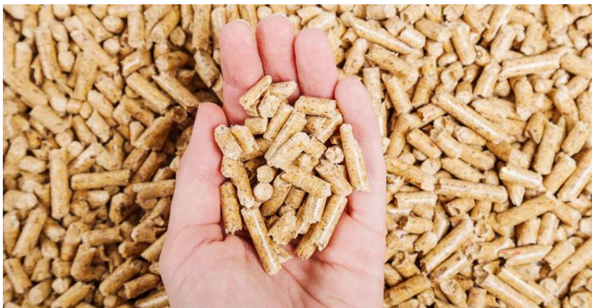
Figura 1.19. Pellets de aserrín (Misiones).

Algunas provincias argentinas carecen de una red de gas natural, y por ende, deben recurrir a otras fuentes para garantizar la provisión energética. A modo de ejemplo, en una provincia netamente forestal como Misiones, se vienen llevando a cabo proyectos que emplean materiales como chips, viruta y aserrín, y sus derivados densificados (como pellets ), para la generación eléctrica y térmica (Figura 1.19). El mercado de pellets es uno de los que mayor crecimiento registra en el mercado internacional como sustitución de combustibles fósiles. En el año 2017, el mercado de pellets estaba valuado en 7,67 mil millones de dólares, pronosticando un crecimiento anual del 9,2% hasta el año 2025, que provendrá especialmente de los mercados asiáticos (Corea, Japón) y Canadá (MAGyP, 2019). En este contexto, nuestro país debiera aprovechar la abundancia de materia prima y las ventajas competitivas que presenta para aumentar su producción de biocombustibles densificados, no solo para el uso local sino también con destino a exportación.