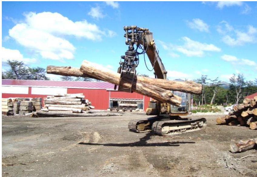
Figura 1.5. Aserradero permanente de Nothofagus pumilio (Tolhuin, Tierra del Fuego).

En cuanto a la ITM de aserrado, la provincia cuenta con aserraderos portátiles (en menor proporción) trabajando dentro del bosque sin localización fija, y con aserraderos permanentes, los cuales están localizados en la localidad de Tolhuin, en el centro de la provincia (Figura 1.5). Predominan los aserraderos de escala “pequeña”, seguidos por los de escala “micro” y en menor proporción, por los aserraderos “medianos”. No existen aserraderos clasificados como “grandes”.