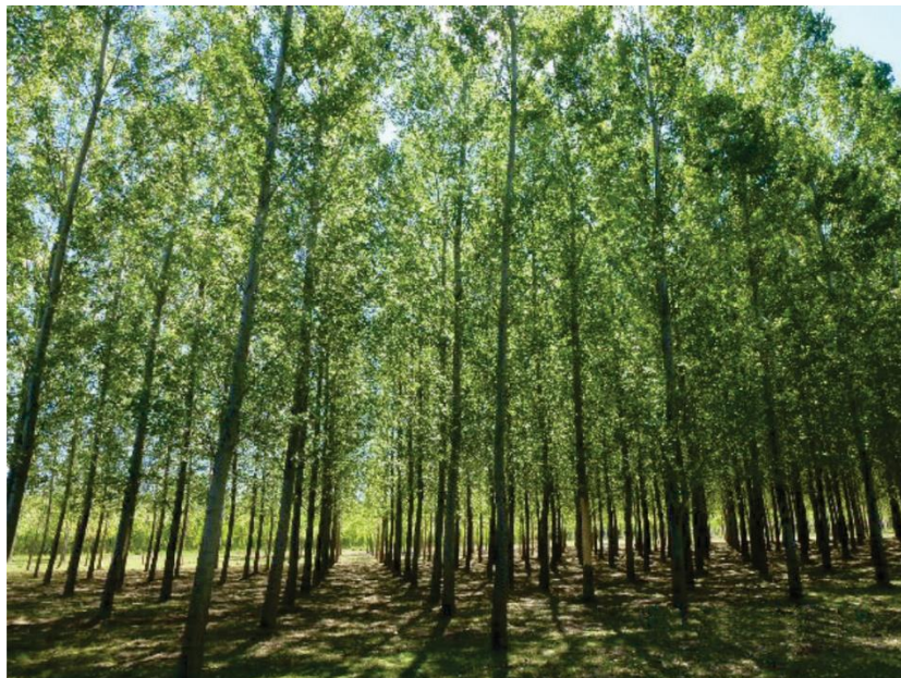
Figura 1.9. Cultivo de Populus spp. en sistema silvopastoril (Catriel, Neuquén).

En cuanto a la ITM de aserrado, según su volumen de producción anual, predominan los aserraderos clasificados como “micro”, seguido en orden de importancia por los de escala “pequeña” y “mediana” (sólo uno), sin existencia de aserraderos en la categoría “grande” (MA, 2018).