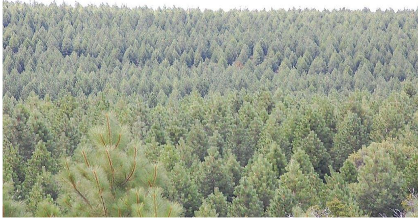
Figura 1.6. Rodales de Pinus ponderosa (Abra Ancha, Neuquén).

respecto a las especies nativas, se advierte un predominio de coihue ( Nothofagus dombeyi ) seguido por roble pellín ( Nothofagus obliqua ).