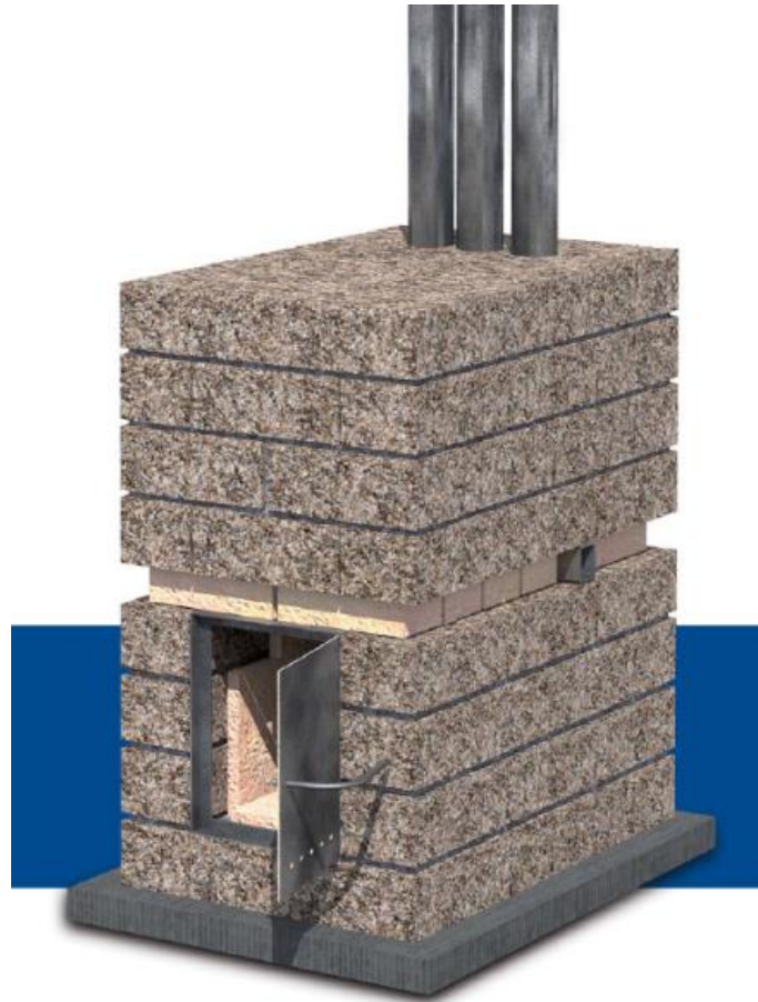
Figura 1.17. Estufa social argentina de alto rendimiento.

La actividad de elaboración de carbón vegetal se asocia principalmente a provincias del norte argentino, predominando Santiago del Estero y Chaco (Figura 1.18). De hecho, el carbón es el principal producto forestal de Santiago del Estero, con una producción que supera las 100.000 tn/año, proveniente de maderas del monte nativo, tales como Aspidosperma quebracho blanco (quebracho blanco), Schinopsis balansae (quebracho colorado chaqueño) y Ziziphus mistol (mistol). Dicha producción abastece tanto el mercado nacional como el internacional. Las exportaciones de carbón vegetal representan el 12% de las exportaciones de productos forestales del país, totalizando unas 52 mil toneladas que equivalen a unos 15 millones de dólares anuales (Comercio Exterior de Productos Forestales, 2018) 5 .