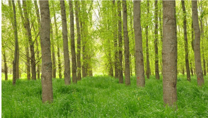
Figura 1.15. Plantación de Salix spp. (INTA Delta Otamendi, Buenos Aires).

La superficie con plantaciones forestales en esta provincia, asciende a 60.091 ha de macizos con salicáceas ( Salix spp. y Populus spp.) ubicadas en la región del Delta del Río Paraná (Figura 1.15), y 7.818 ha de macizos con Eucalyptus spp. ubicadas en la región de secano, específicamente en el sudeste de la provincia (MA, 2017). Por su parte, en la región de secano correspondiente a las sierras de Tandil y Balcarce, existen plantaciones de Pinus radiata con manejo de podas para la producción de madera aserrada de calidad.