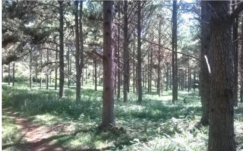
Figura 1.2. Plantación de Pinus spp. (Eldorado, Misiones).