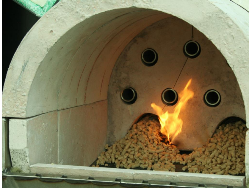
Figura 1.20. Quemador industrial de caldera a base de pellets.

En Argentina, se han desarrollado casos exitosos de uso de pellets en hoteles, comercios y hogares. En Puerto Iguazú (Misiones), la mayoría de los hoteles utilizan calderas en base a pellets. Estas calderas son de alta eficiencia y con sistemas computarizados que optimizan el uso del combustible para generar energía térmica para calefacción y agua caliente (Figura 1.20).