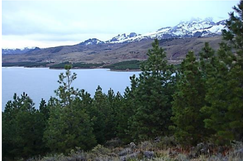
Figura 1.8. Forestación de Pinus ponderosa (Bariloche, Río Negro). Fuente: propia (viaje de estudios Ing. Ftal., 2014).