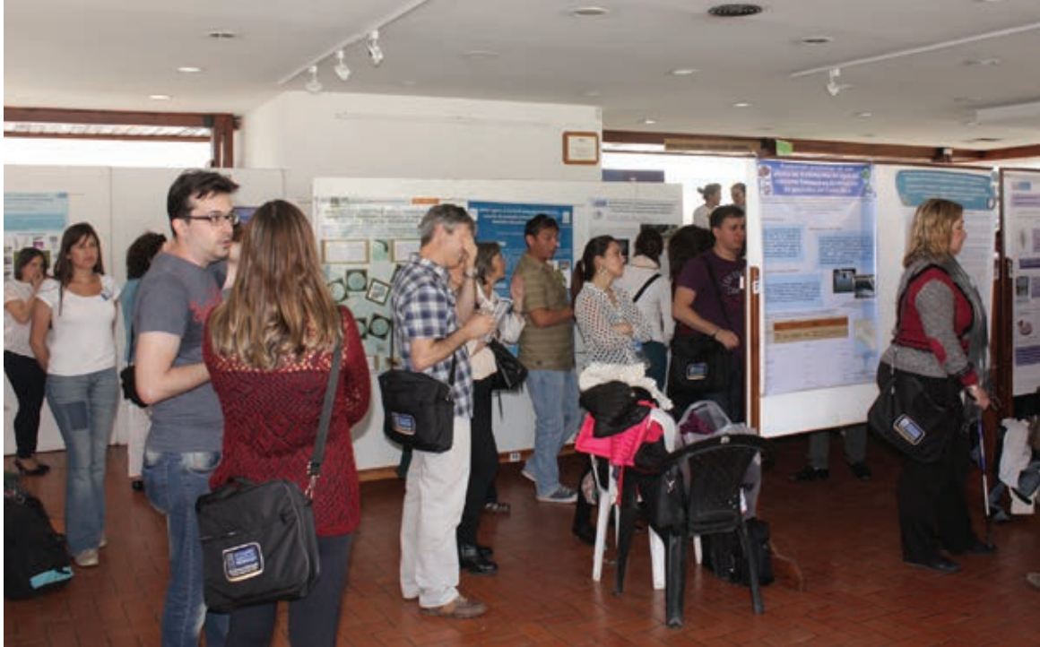
Sesión de posters en el SCUM.