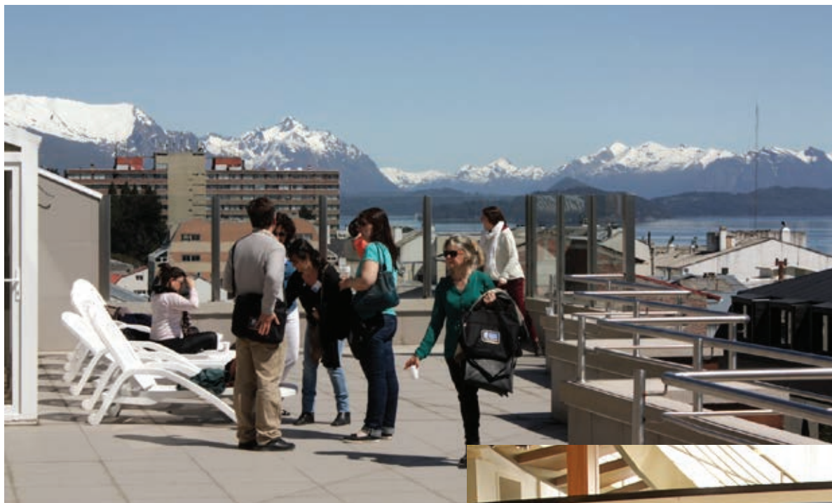
Coffee break durante el Congreso.

en Ciencias Biológicas de la UNCo (Bariloche) colaboraron como auxiliares en la atención al público durante esa semana.