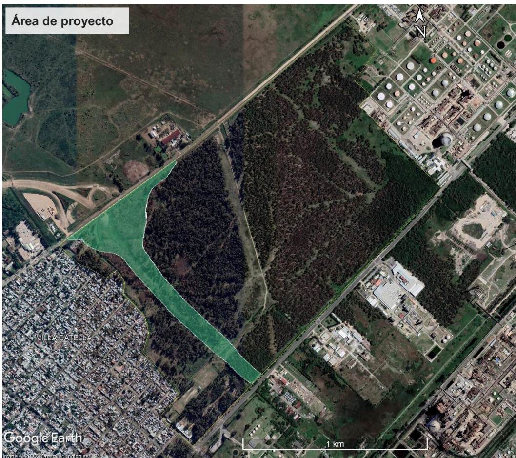
Imagen 1. Vista aérea general del predio

El área de estudio ocupa el límite sudoeste del Parque Gobernador Martín Rodríguez de la Ciudad de Ensenada, Provincia de Buenos Aires (Imagen 1). De acuerdo al historial de imágenes satelitales examinadas, la superficie forestal total del parque hasta que se iniciaron los trabajos de desmonte era de 184 hectáreas (ha).