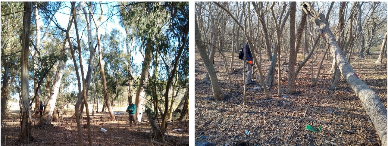
Foto 1 y 2. Vista general de: sector con eucaliptos (izq.); sector con fresno (der.)

vuelco por acción del viento. Se observa un estancamiento del crecimiento de la forestación, con un deterioro en las partes superiores de los árboles, apreciándose una elevada frecuencia de mortalidad apical de las copas de los eucaliptos en particular. Este fenómeno habitualmente se observa en plantaciones forestales sobre maduras, cuyos árboles han alcanzado su máximo de altura e ingresan en una etapa de decrecimiento o desmoronamiento en su evolución natural con la edad. Es decir, si se utiliza como parámetro la capacidad de fijación de CO 2 , una plantación en este estado se encuentra en una fase de mínima capacidad de secuestro o fijación por la pérdida de vigor de crecimiento, lo que, a su vez, vuelve a los individuos más susceptibles a la afectación por plagas y/o enfermedades.