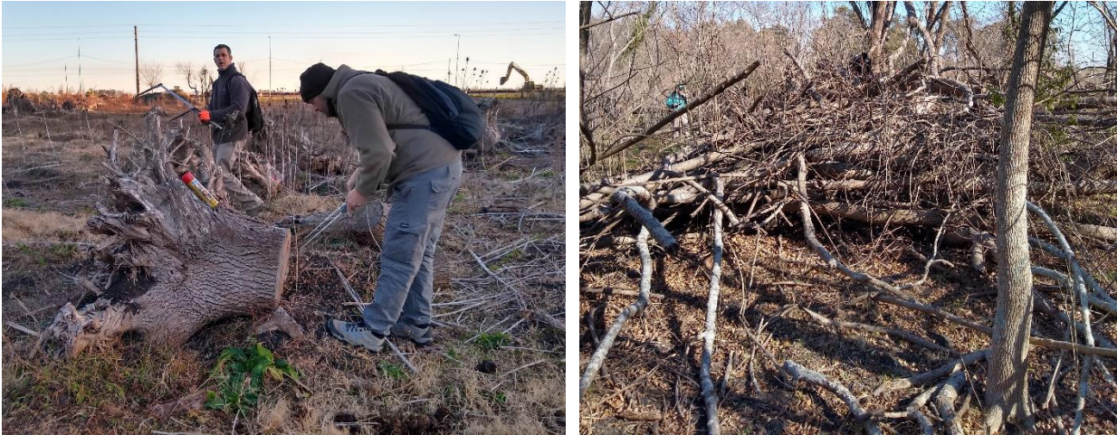
Foto 3 y 4. Izq. Medición de tocones dispersos en el área desmontada. Der. Medición de tocones y árboles volteados en escolleras en los laterales del área desmontada.

Junto con los trabajos de mensura, se realizó un registro fotográfico de carácter general, representativo de la situación del arbolado hallado en los diferentes sectores estudiados.