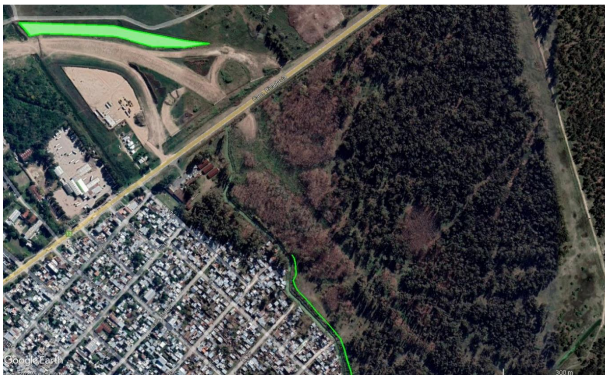
Imagen 4. Ubicación propuesta para el macizo forestal lindero con la traza de autopista en el sector al norte del Camino Rivadavia.

En el segmento norte de la traza de la nueva obra, en el sector comprendido entre el fin de la actual autopista y el camino (Imagen 4), se propone la realización de una forestación en macizo. Por las características zonales de los suelos y la aptitud de las especies ya probadas en la zona, se sugiere emplear: Eucalyptus camaldulensis "Eucalipto colorado"; Fraxinus pennsylvanica "Fresno" y las nativas Parkinsonia aculeata "cina-cina", Celtis tala "Tala", Blepharocalyx salicifolius "anacahuita". Se propone crear macizos por especie, con una densidad de 1.100 plantas por hectárea, equivalente a un espaciamiento inicial de 3m x 3m. De acuerdo a cálculos preliminares, la superficie disponible es de 1 ha e involucraría el uso de un total de 1.100 plantas.