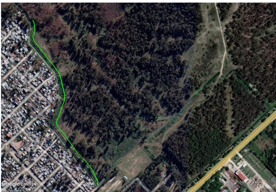
Imagen 3. Ubicación propuesta para la franja forestal adyacente al canal lindero con Villa Catela.

Se sugiere que la franja lindera con el canal sin forestación incluya al menos 5 hileras de ancho. De acuerdo al análisis de imágenes satelitales, esta tendría aproximadamente 760 metros de largo y 1.267 plantas totales, sin considerar las reposiciones que puedan requerirse.