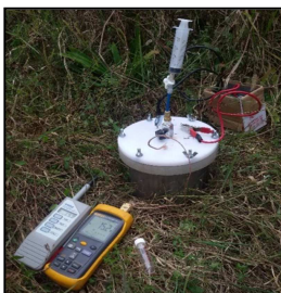
Figura N° 1: Cámara estática.

Teniendo en cuenta que las estimaciones de flujos mejoran al tomar mayor cantidad de muestras a expensas de un menor número de cámaras (Levy et al., 2011): se utilizaron 3 cámaras por punto de muestreo (parcela de 100 m 2 ), tomando en cada cámara 5 muestras de gases (colectadas en jeringas de 20 ml) en intervalos de tiempo de 10 minutos (0, 10, 20, 30, 40). Posteriormente las muestras de gases fueron conservadas en viales de 12 ml hasta su posterior análisis en laboratorio del Centro de Investigaciones en Física e Ingeniería del Centro de la Provincia de Buenos Aires-Tandil (Argentina).