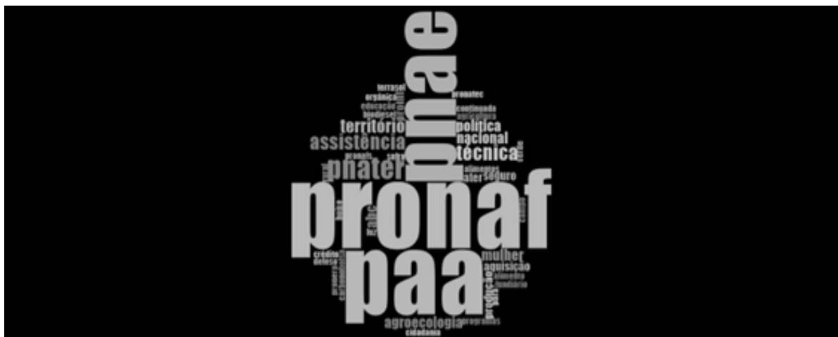
FIGURA 1 Nuvem de palavras extraída da categoria “políticas públicas mais importantes de inclusão produtiva”