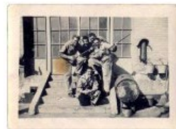
El papá de Iñakió sentado en las escaleras, 1957.